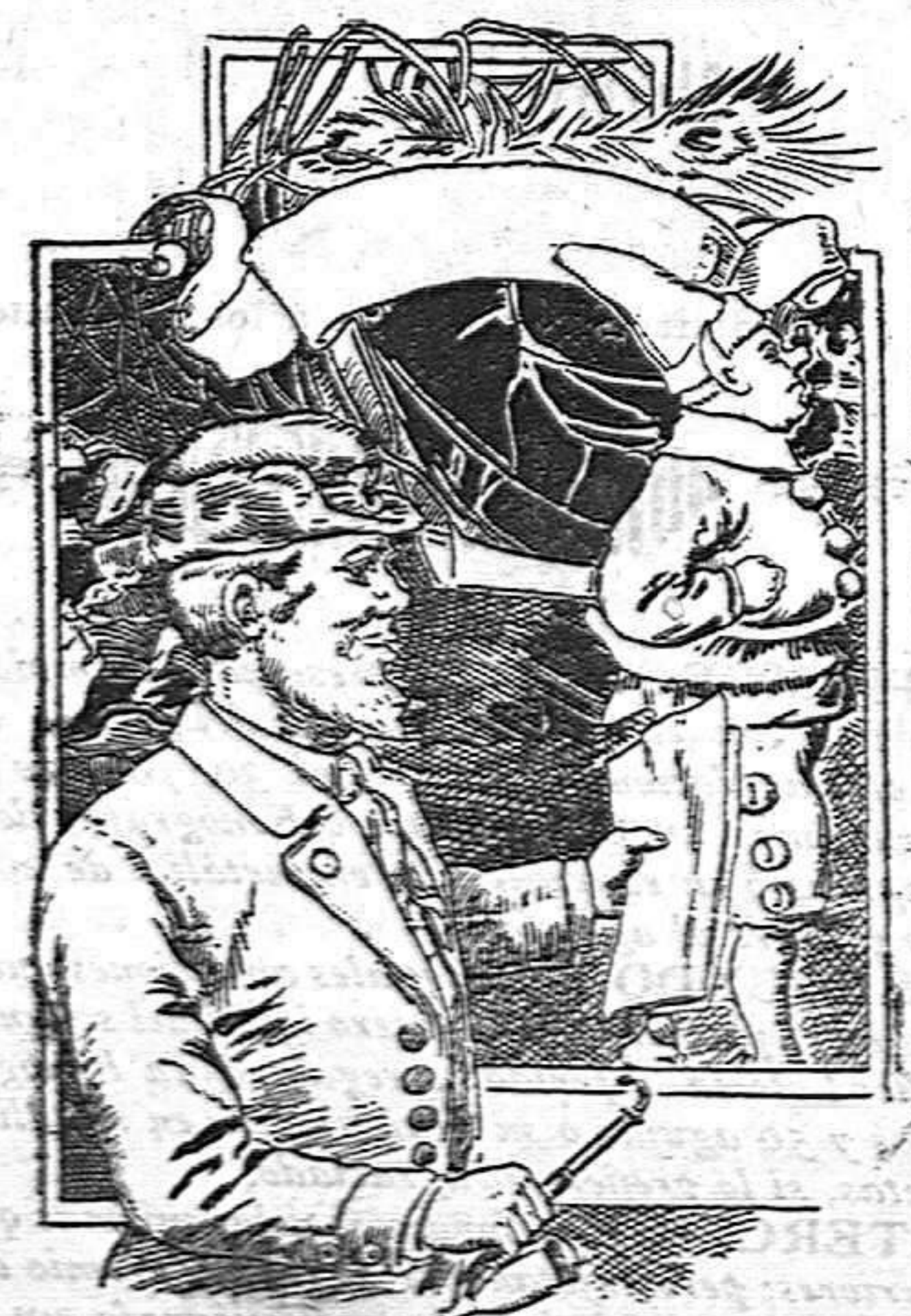
Falta un caballero