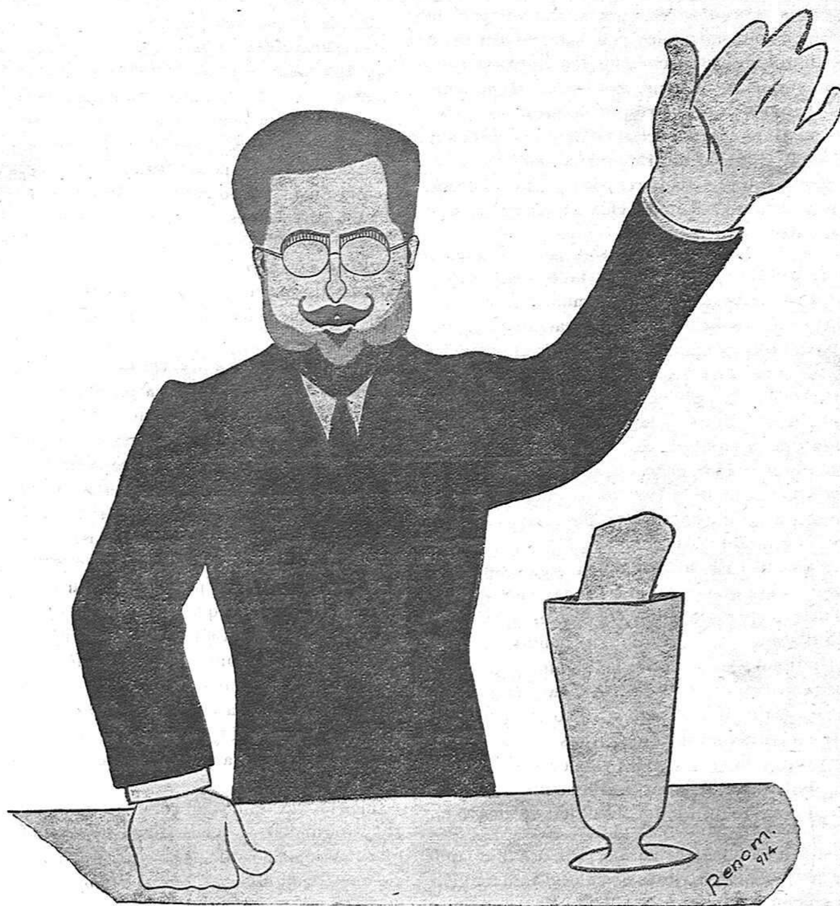
EL NOSTRE BATLLE, CONFERENCIANT