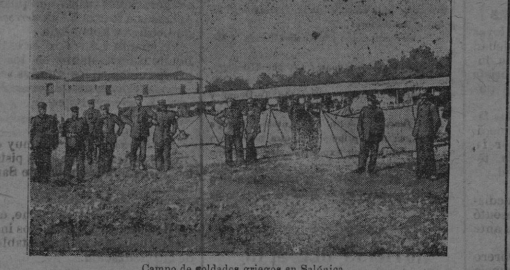
Campo de soldados griegos en Salónica