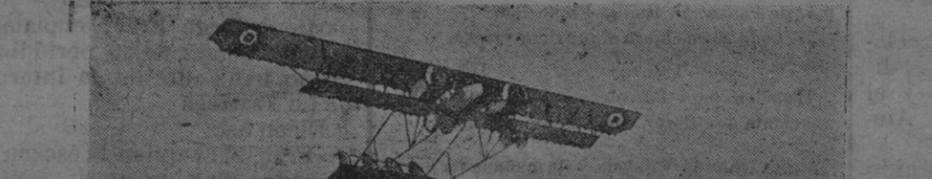
Un biplano francés practicando vuelos sobre los alrededores de Salónica