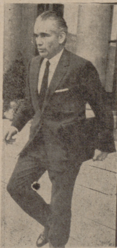
PARIS.—El primer ministro francés, Jacques Chaban Delmas, elegido nuevamente en las elecciones parciales de Burdeos, camina de prisa para escapar a las preguntas de los periodistas a su salida del Palacio del Eliseo, después de entrevistarse con el Presidente Pompidou.