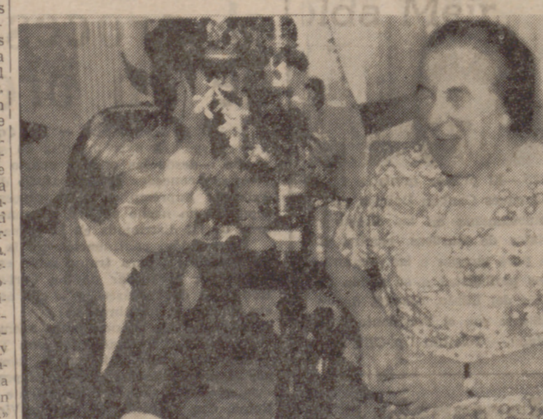
NUEVA YORK.—La primer ministro de Israel, señora Golda Meir, ríe de muy buena gana por algo que acaba de contarle el gobernador neoyorquino, Nelson Rockefeller, cuando éste visitó a dicha señora en el Waldorf Astoria.

ESTUDIANTE: En caso de accidente escolar, la Mutualidad del Seguro te amparará en la asistencia médico-farmacéutica completa, internamiento hospitalario, intervenciones quirúrgicas e indemnizaciones económicas. Infórmate en el Instituto Nacional de Previsión.