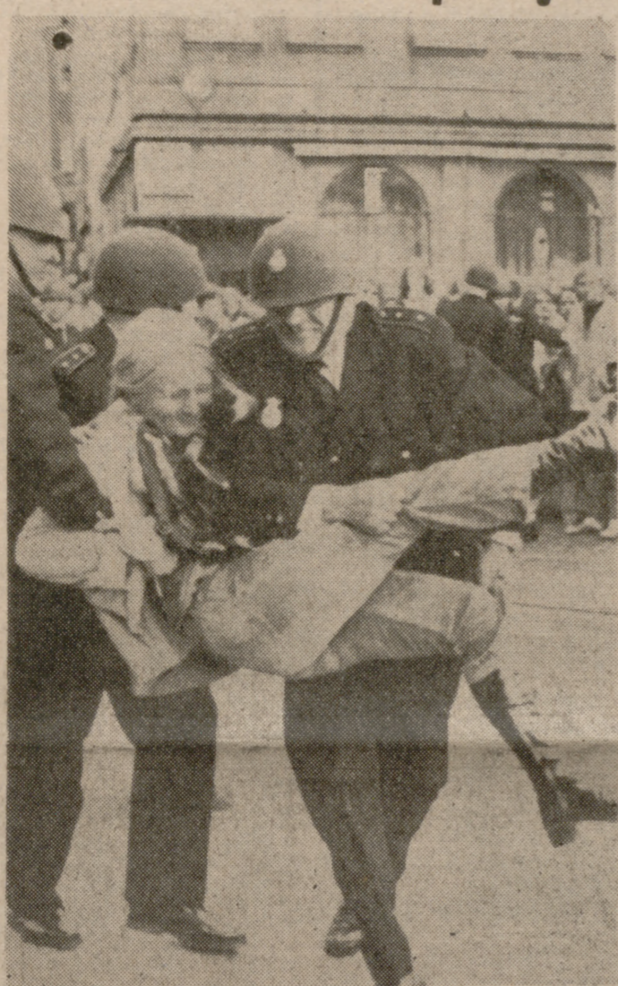
COPENHAGUE.—Se han registrado en esta capital manifestaciones contra la reunión de los delegados del Banco Mundial. Dichas manifestaciones tuvieron lugar en las proximidades del Hotel Inglaterra, donde los delegados asistían a una recepción. La Policía hubo de intervenir para disuadir a los más levantiscos. En la foto, una joven manifestante es detenida por la Policía.

MADRID. (Cifra).—El encargado de Negocios de la Embajada de la República Árabe Siria en Madrid, señor Wasfi Aflah, ha remitido a la agencia "Cifra" el siguiente comunicado: