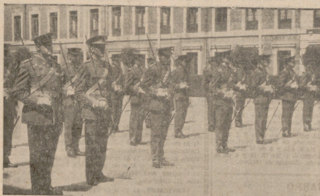
Un momento de la solemne ceremonia.

A las once y media de la mañana en el Patio de Armas de la Academia de Caballería, se celebró la entrega de despachos a los nuevos tenientes del Arma que integran la XXIV Promoción.