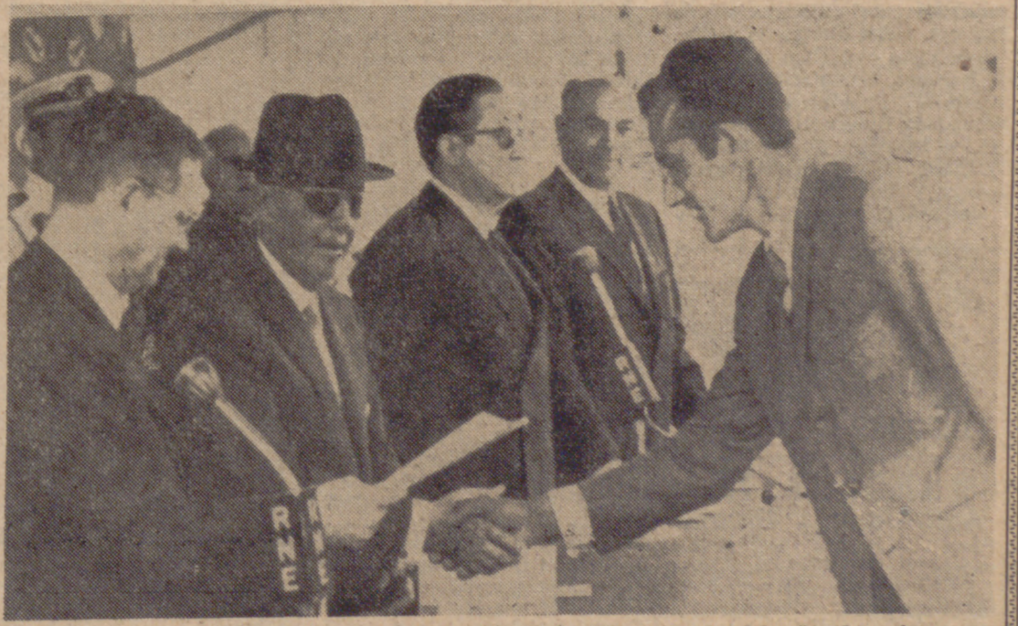
CORDOBA.—El Caudillo entrega los títulos del poblado "Mesas de Guadalupe" a los colonos, en la mañana de ayer. A las seis de la tarde, el Jefe del Estado regresó al Palacio de El Pardo.