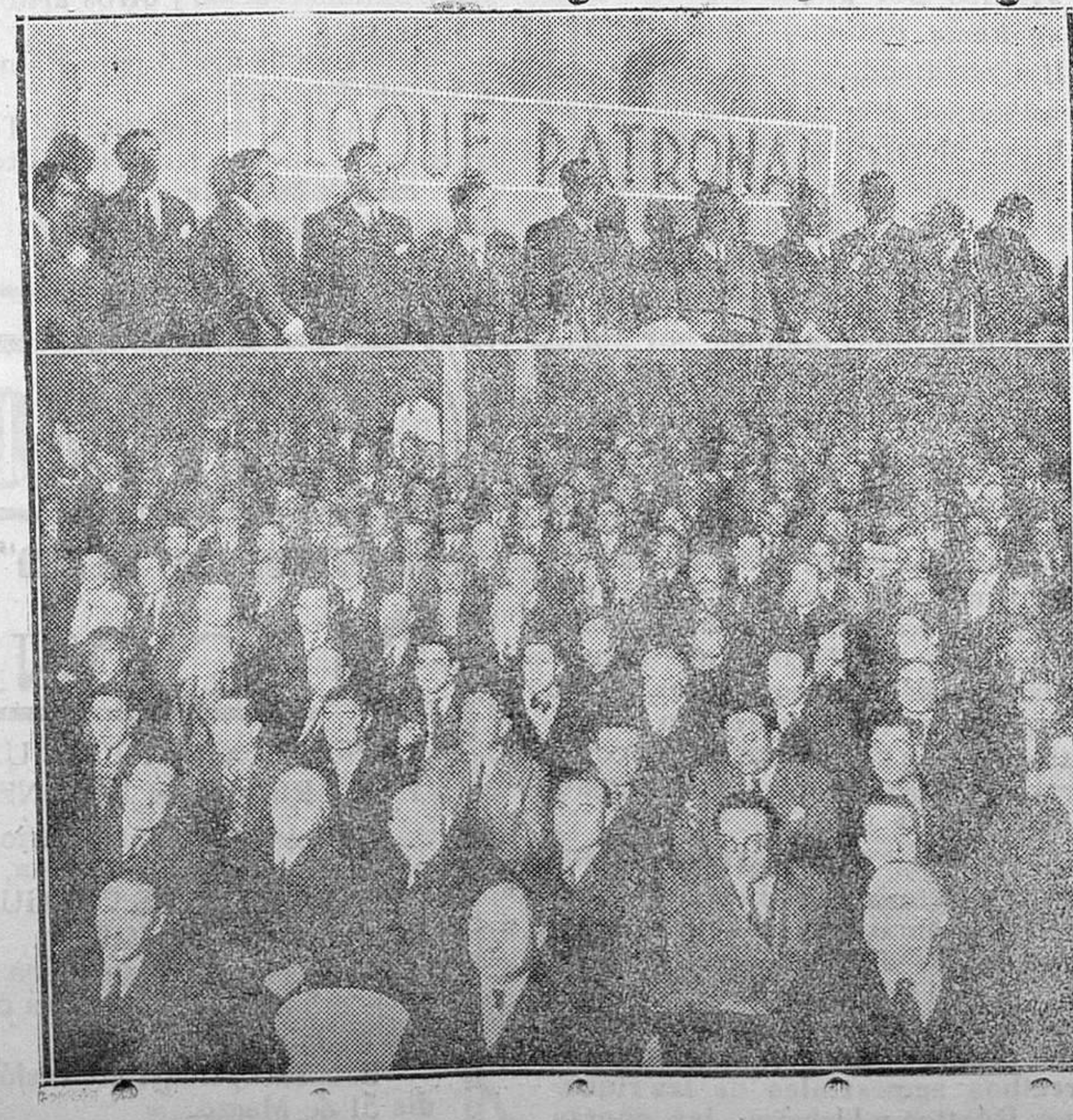
MADRID.—Importante asamblea de los patronos madrileños, celebrada en el Cine de la Ópera, en la que quedó constituido el bloque patronal. Arriba, los oradores y presidencia de la Sala. Abajo, un aspecto