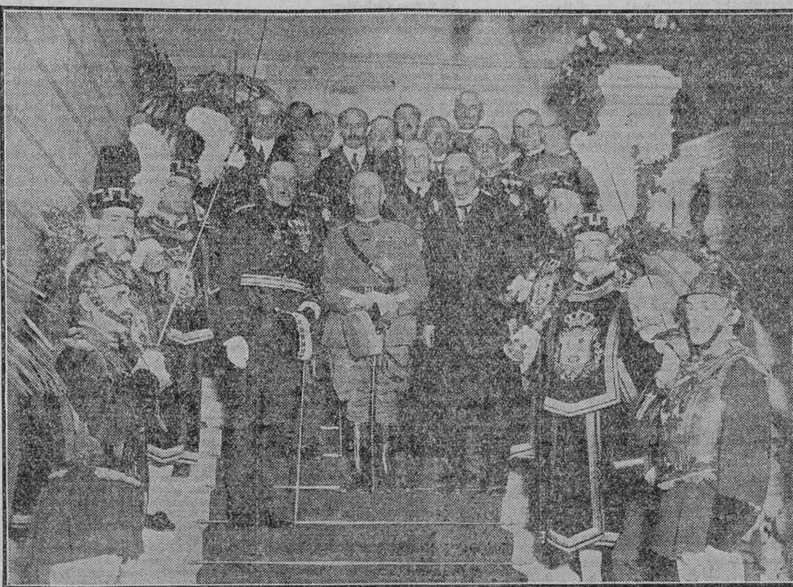
EL ALCALDE DE MADRID DESPIDIENDO A LOS REYES DE ITALIA Y ESPAÑA AL TERMINAR EL BANQUETE Y RECEPCION CELEBRADA AYER EN EL AYUNTAMIENTO

Además de los reyes de Italia y España asistieron sus séquitos correspondientes, los miembros del Directorio, menos el presidente, subsecretarios de los distintos departamentos ministeriales, director de Administración local, gobernador civil, capitán general de la primera región, presidentes del Consejo de Estado, del Supremo de Guerra y Marina, del Tribunal Supremo, Audiencia territorial, obispo de Madrid-Alcalá, presidente de la Diputación provincial, primer introductor de embajadores, embajador de España en el Quirinal, presidentes de las Cámaras de Comercio de la Propiedad, de la Industria, del Círculo de la Unión Mercantil, de la Asociación de la Prensa y el periodista italiano Uff. Dafina y el Ayuntamiento en pleno. El almuerzo fue servido por Lhardy. Al servir el champagne, el alcalde, señor