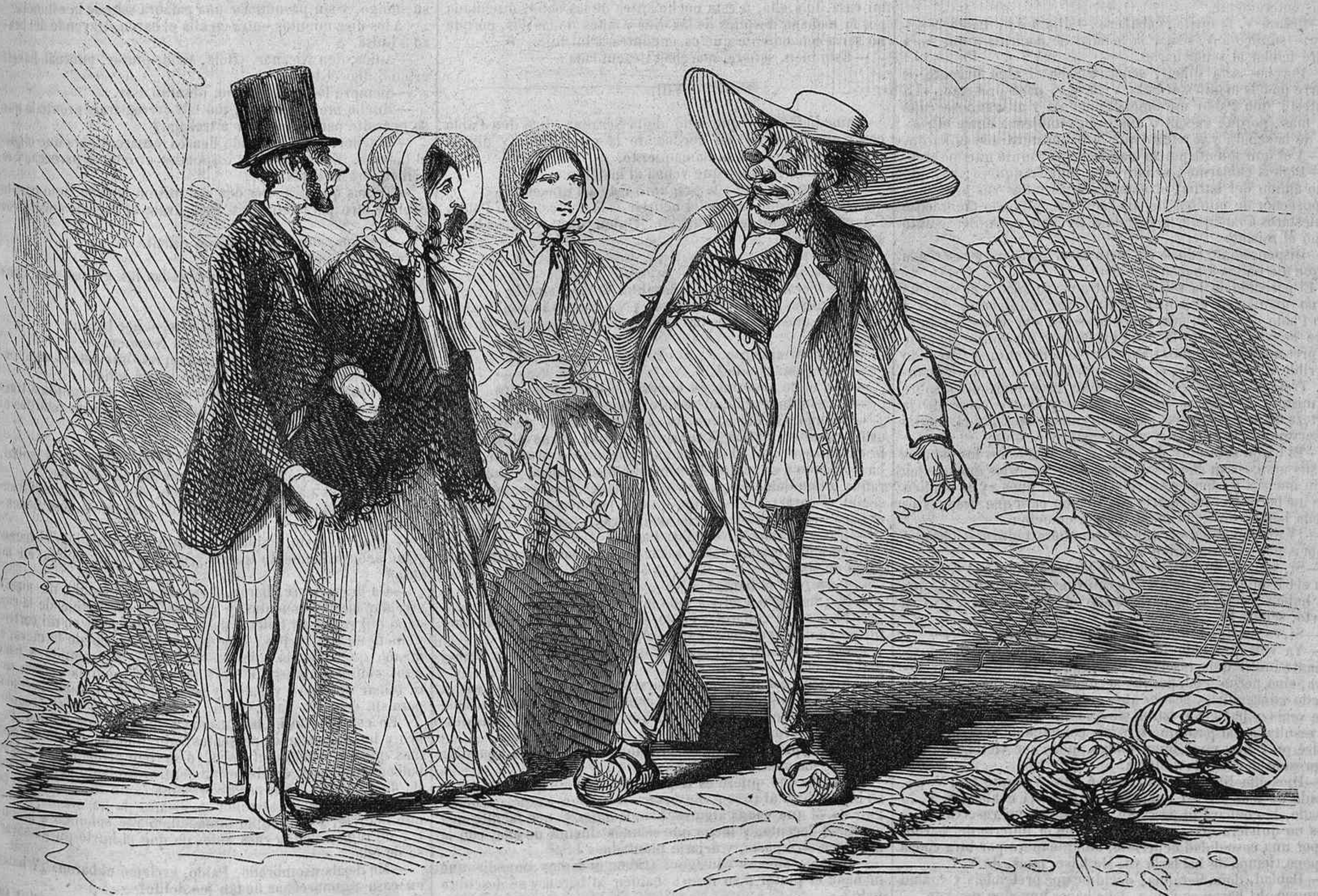
El madrileño en el campo.

—Buenos dias, querido tio... vivan las diligencias; salimos á las ocho de Madrid y llegamos á esta quinta justamente á la hora de comer.