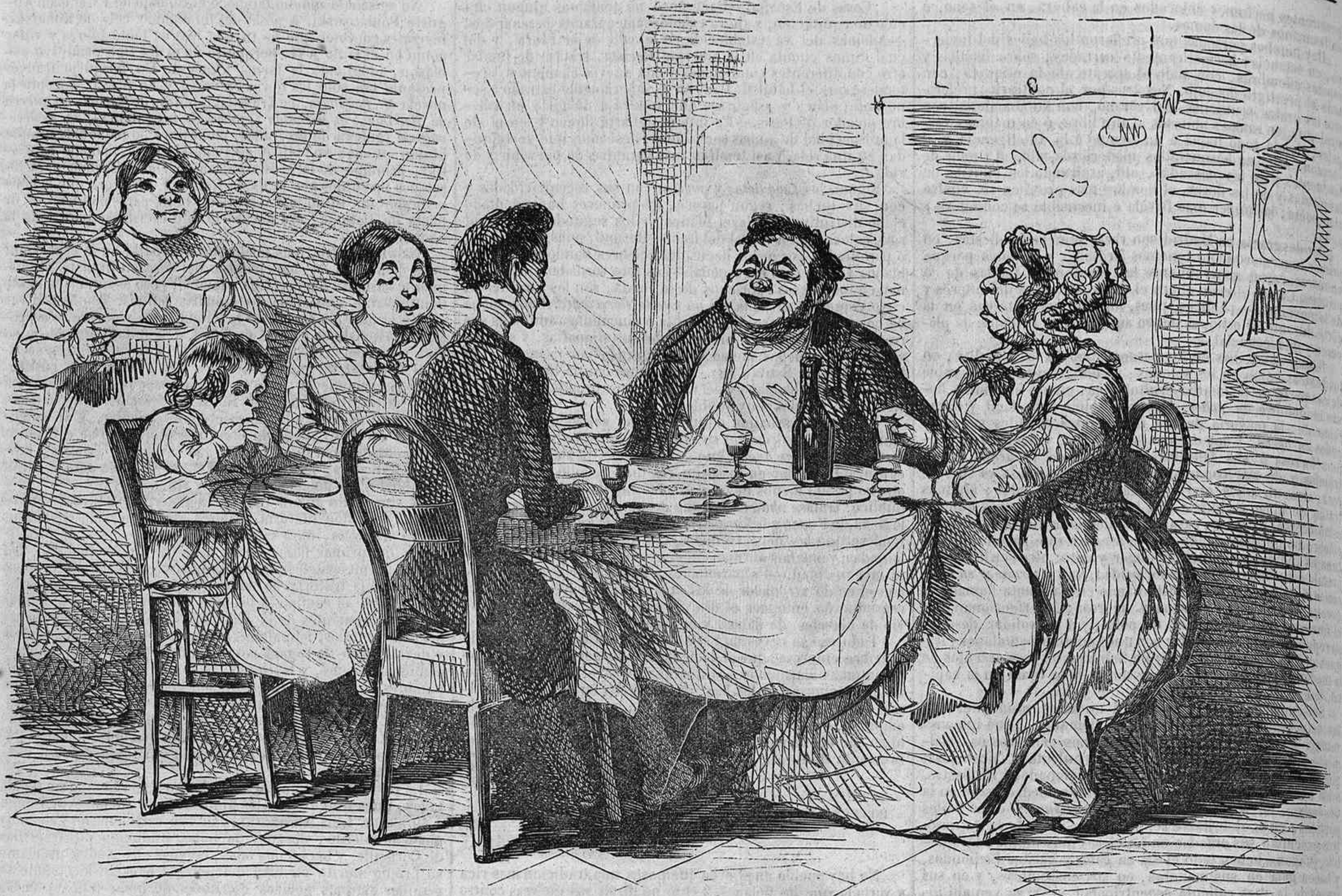
Un convidado de Madrid en provincia.

—Amigo, aquí nos desayunamos, almorzamos, volvemos á almorzar mas tarde, tomamos las once, comemos, merendamos, refrescamos, cenamos y á veces tomamos un bocadito antes de acostarnos. No tenemos otra cosa en que pasar el tiempo y nos vá bien con este método.