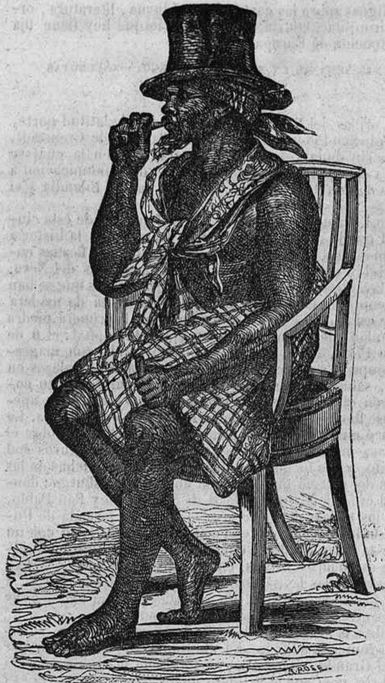
Rey de los mandingas.

costumbre consiguieron apartarlos los europeos atrayéndoles con el cebo poderoso del interés. Estas tribus se conocen con diferentes nombres. Las mas principales son las de los cangás , la de los carabalis , la de los nangobás , la de los congólts , y la de los mandingas . Cada una de ellas reconoce un jefe ó rey que les guía al combate y en quien recae generalmente el beneficio de la venta de los prisioneros. El traje de estos personajes, como ven nuestros lectores, no es de los mas elegantes: compónese de los adornos que compran á los europeos ó de una especie de túnica que se rodean al cuerpo. El rey de los mandingas lleva generalmente un gran chal y cubre su cabeza con un pañuelo, encima del cual se pone en ocasiones solemnes un sombrero redondo por el estilo de los que se usan en Europa.