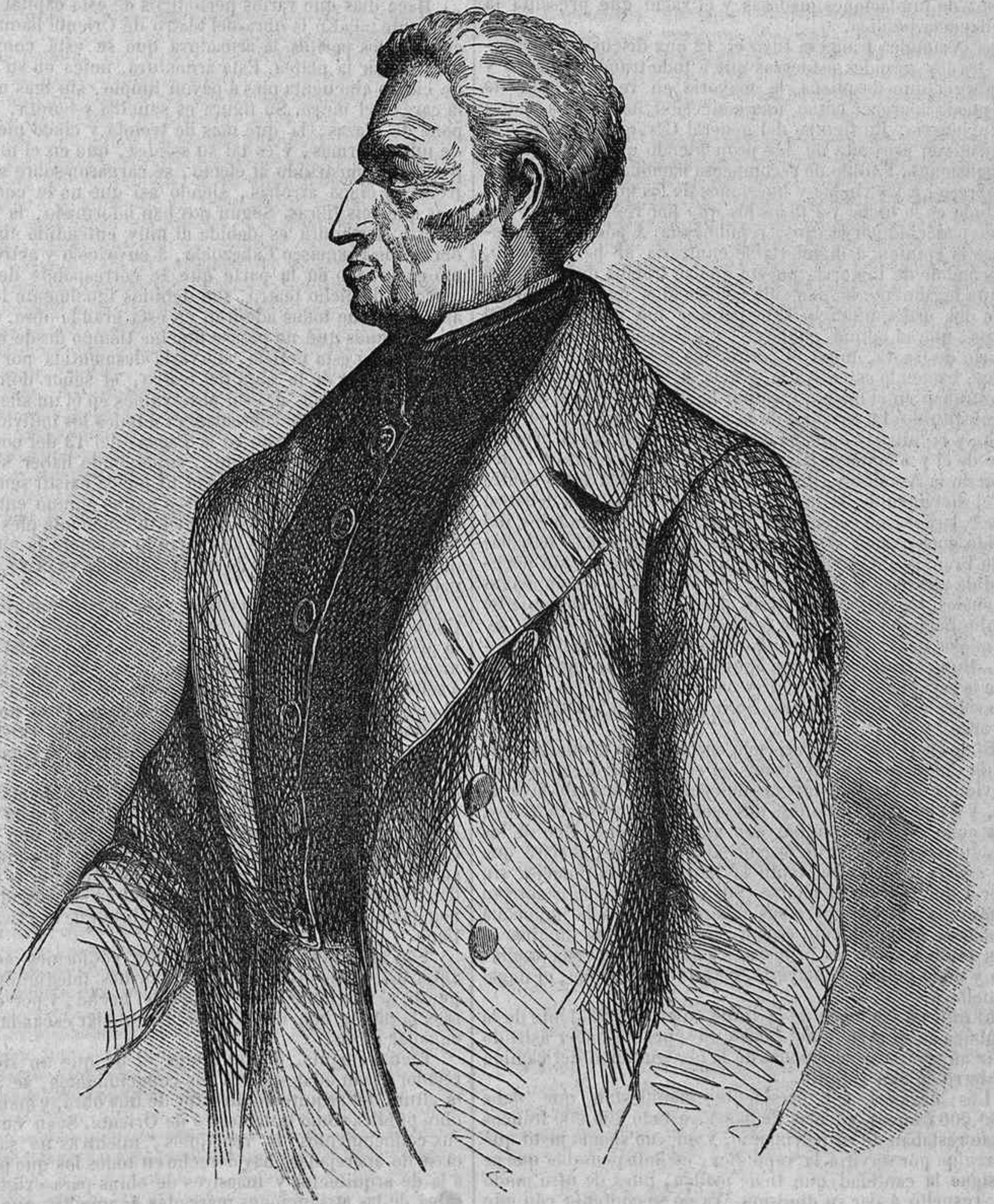
Taylor, presidente de los Estados-Unidos.