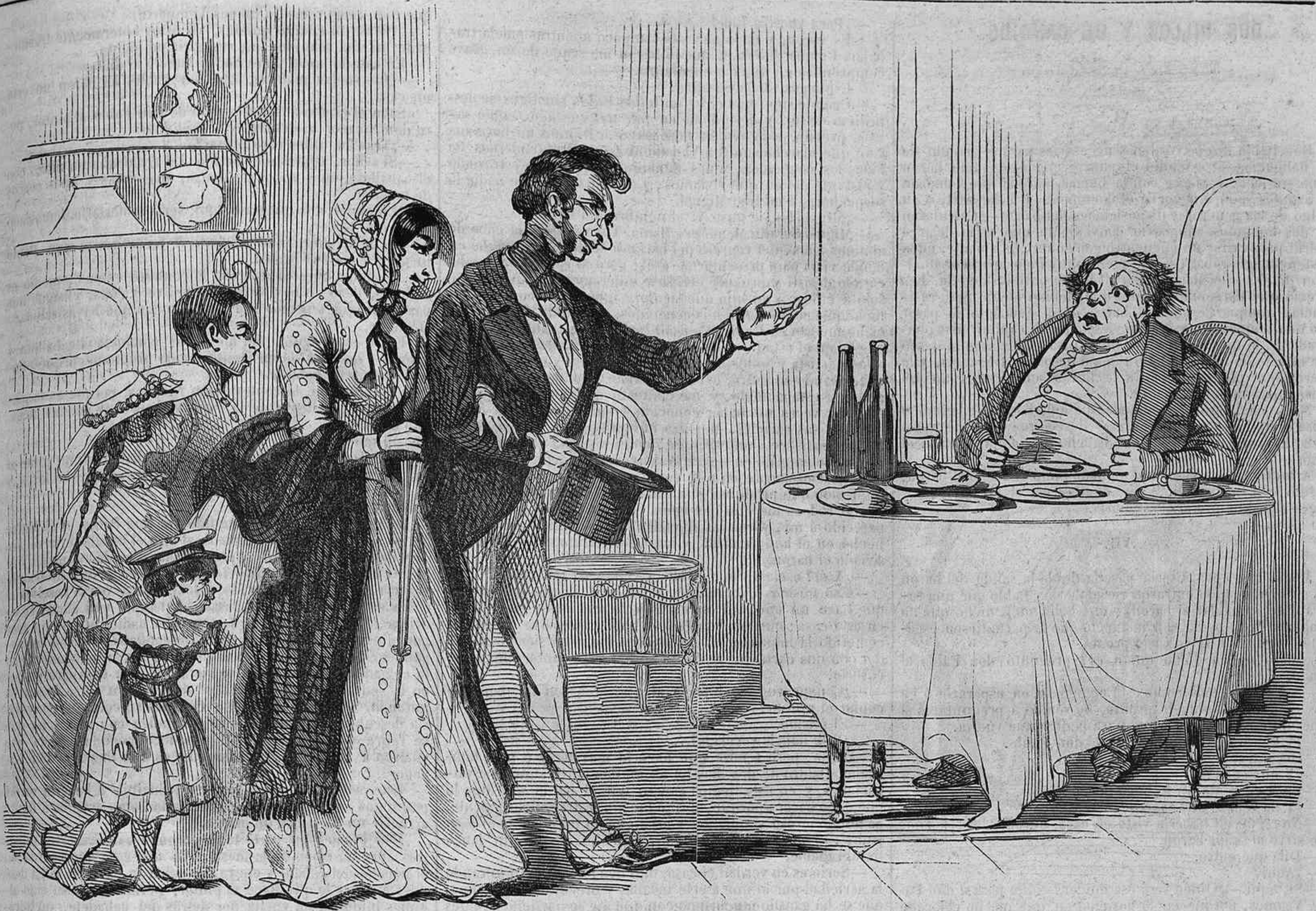
Una visita agradable.

—Buenos dias, querido tio... vivan las diligencias; salimos á las ocho de Madrid y llegamos á esta quinta justamente á la hora de comer.