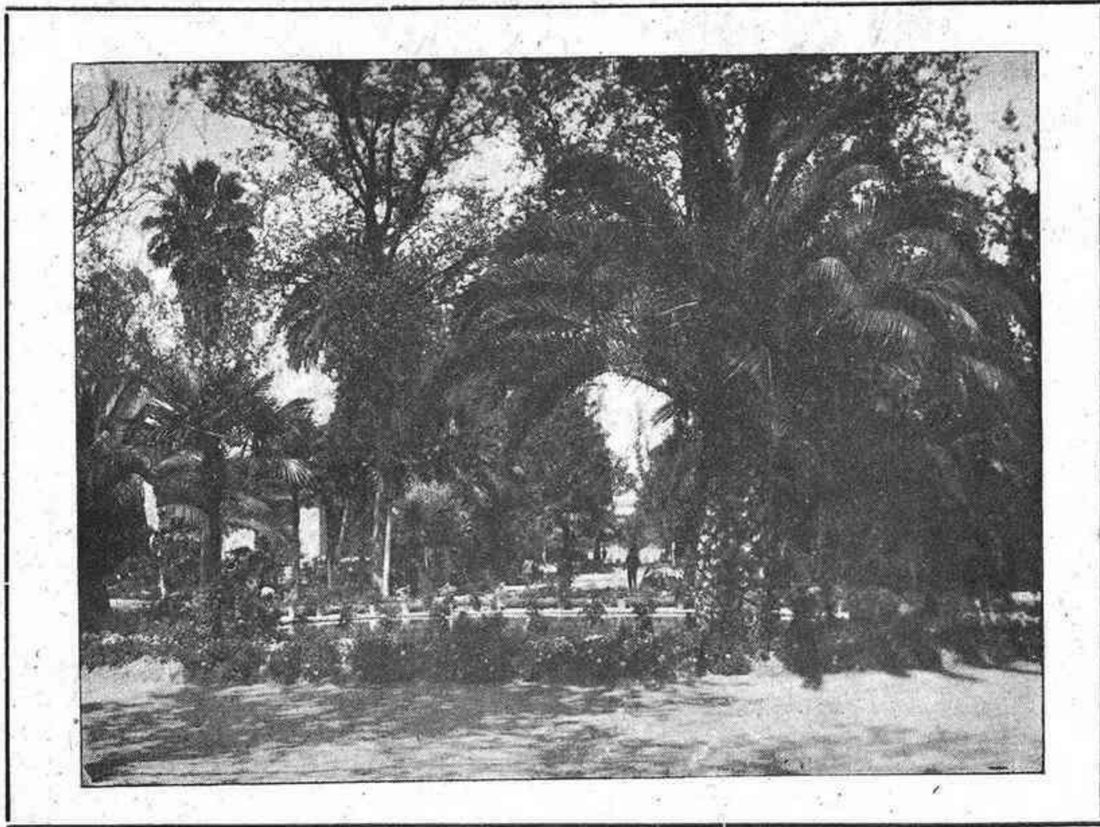
CÓRDOBA: Una fuente en los Jardines de la Agricultura

Organo de la Federación de Sindicatos Católico-Agrarios de Córdoba