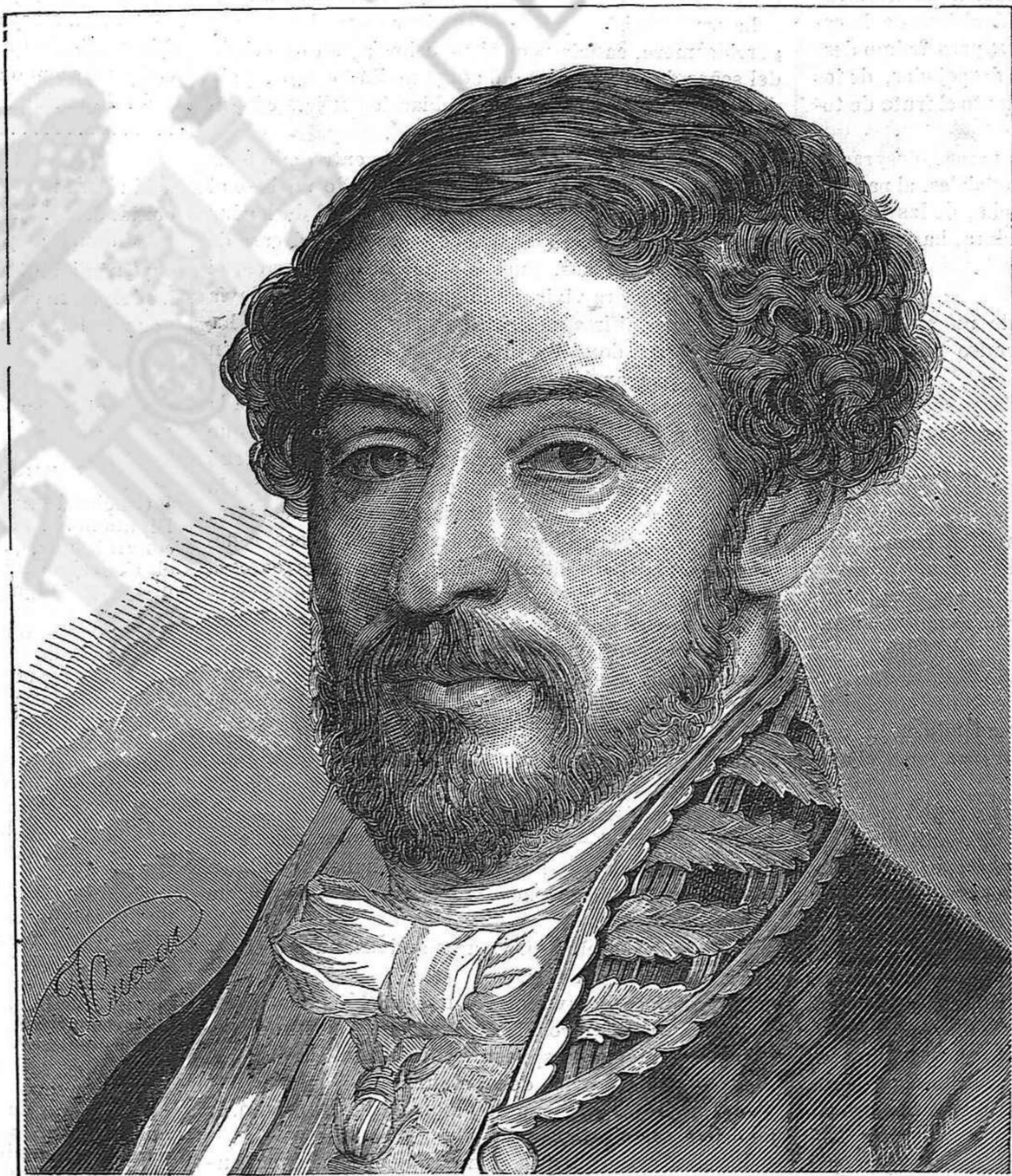
EXCMO. SR. D. NICOMEDES PASTOR DIAZ.

Nuestros habituales lectores habrán advertido en los números de LA ILUSTRACION publicados en este año cierta modificacion en su carácter y tendencia. Sin perder la índole literaria y de noticias que hasta hoy ha tenido exclusivamente, aspira á tomar tambien el carácter económico-social, que el Propietario, desde su regreso de la Habana, cree reclaman, así las necesidades más patentes del país á que consagra sus afanes, como los gustos y la conveniencia de la mayoría de sus abonados. Allado del artículo histórico ó descriptivo, de la no-