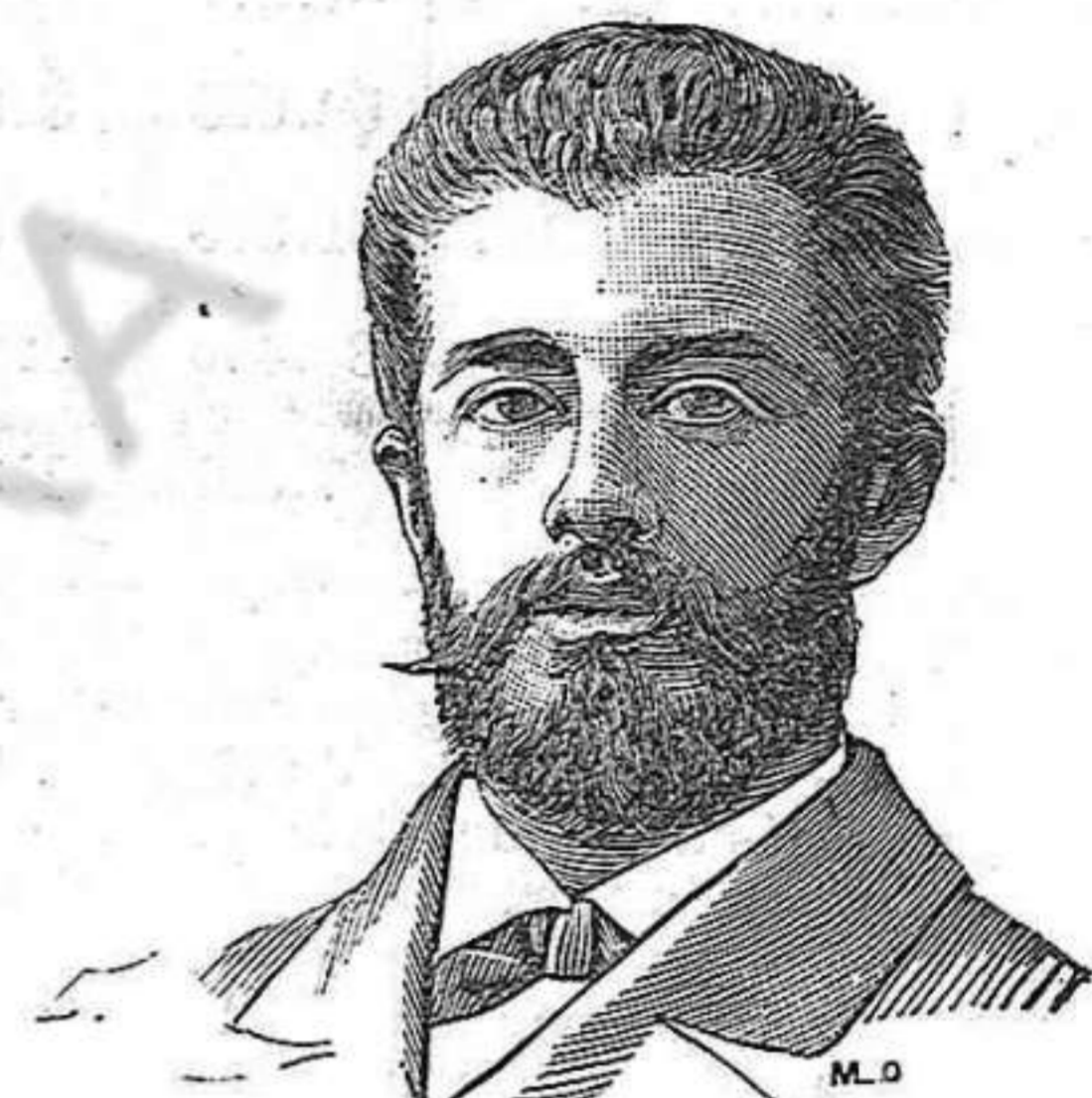
D. José Riestra Diputado (Estrada-Pontevedra).