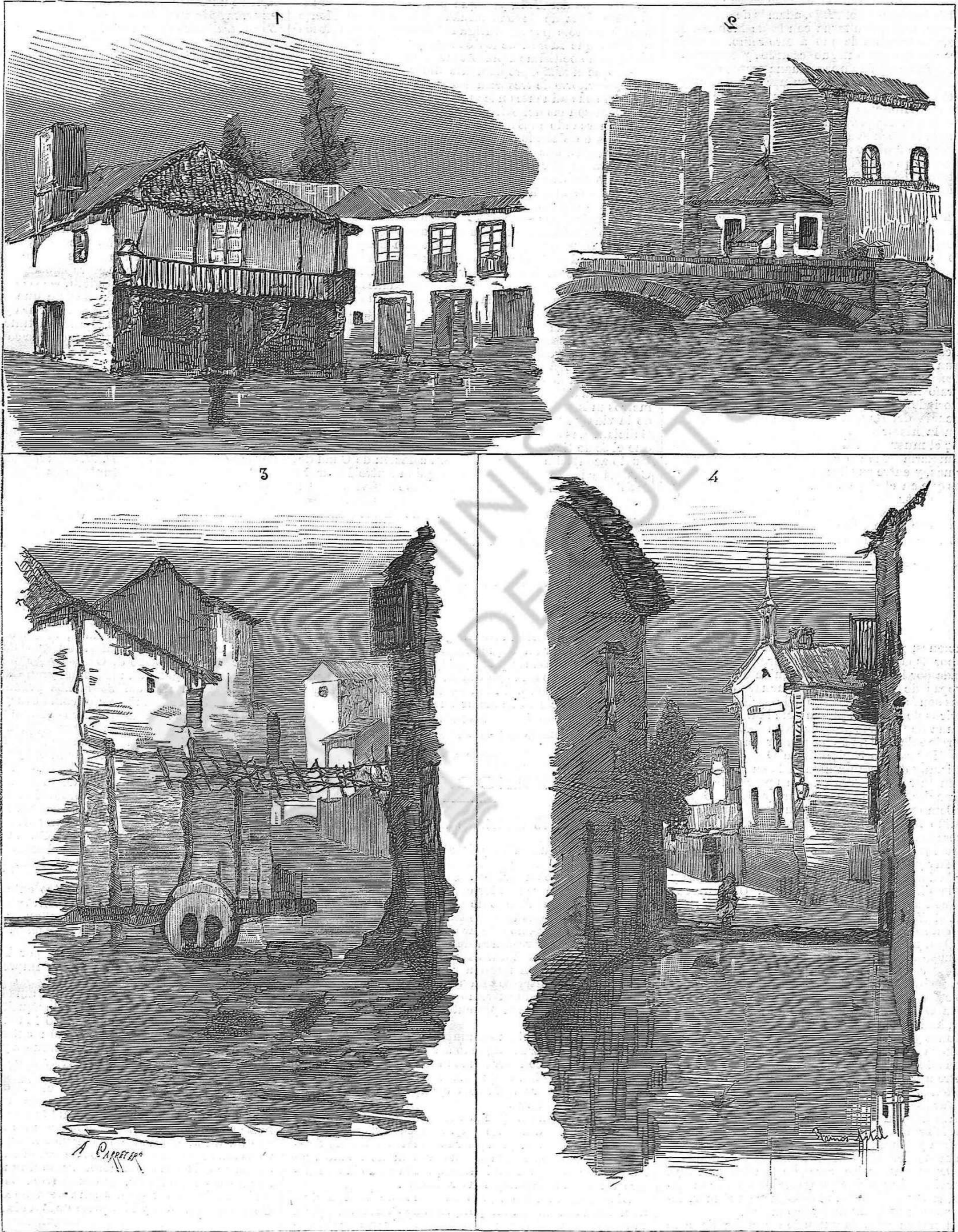
1. Plaza del Hilado.—2. Puente del Espolon.—3. El Burgo Nuevo.—4. Calle del Sol.

(Dibujo remitido por nuestro corresponsal artistico Sr. Ramos Artal.)