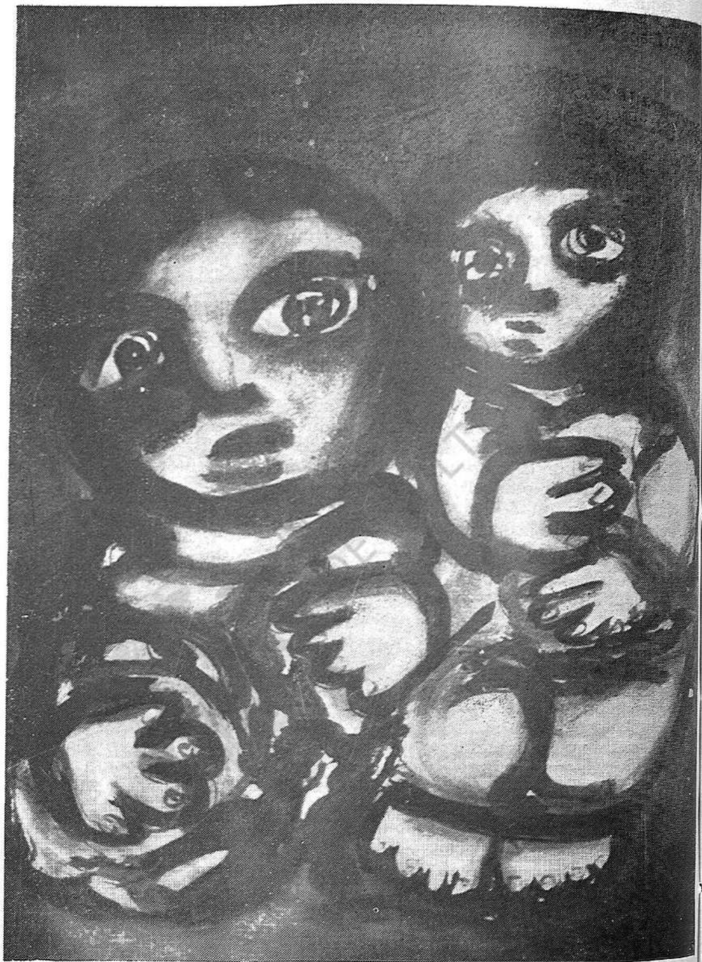
Dibujo de Mercedes Ruibal.