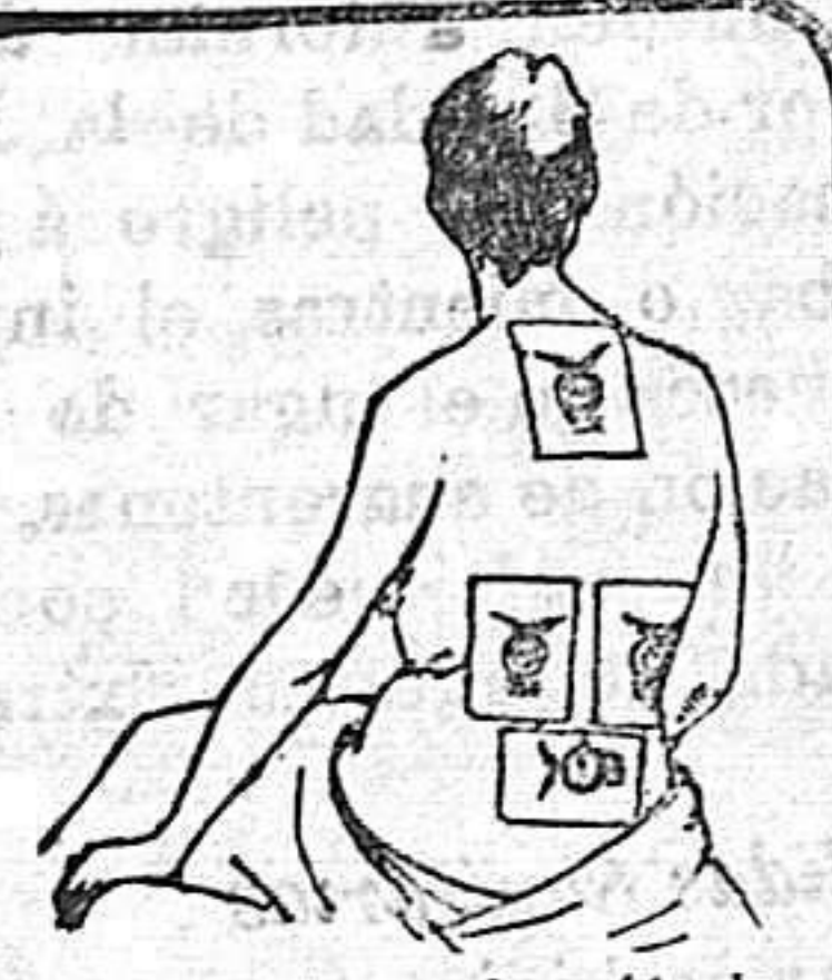
Para dolores en la región de los Riñones ó para la Debilidad de las Caderas, el emplastro deberá aplicarse como se vé arriba. Donde haya dolor póngase un emplastro de Alcock.

Remedio universal para el dolor de caderas (tan frecuente entre las mujeres).