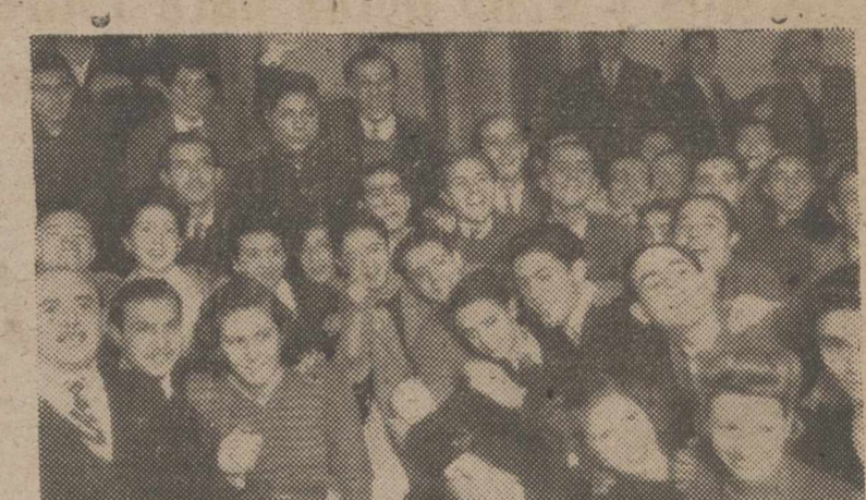
En unas horas las afecciones se troncaron en buena ventura y alegría. El milagro lo ha hecho el sortilegio magnífico de la Lotería. ¡Se terminaron las dificultades y la cuestión de enero es ahora una senda llena de sonrisas y de promesas!