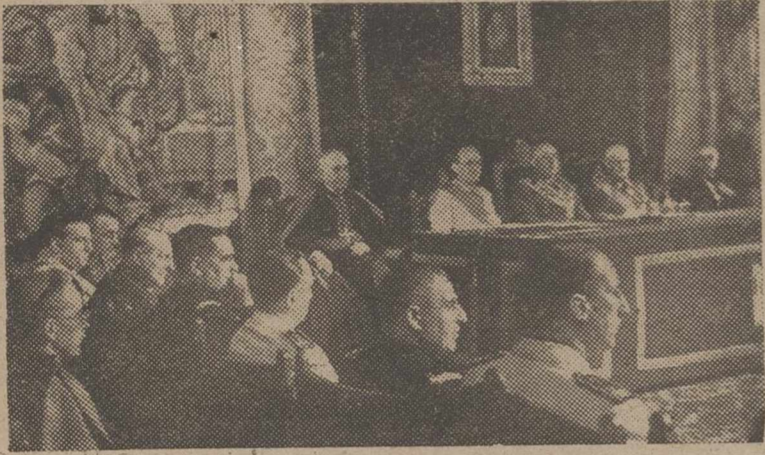
El Caudillo acompañado del Gobierno y altas personalidades científicas y civiles, clausuró el VI Sesión Plenaria del Consejo Superior de Investigaciones Científicas.