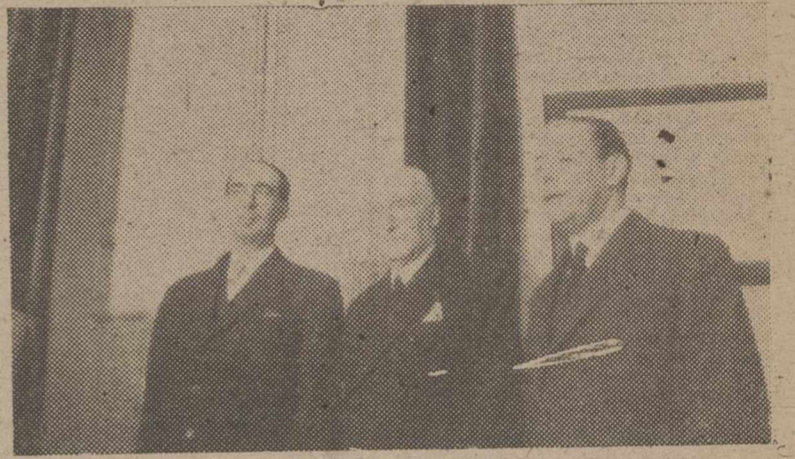
El Director del Comisariado Marítimo de Seguros y dos funcionarios que han sido agraciados con una gran participación del «gordo».