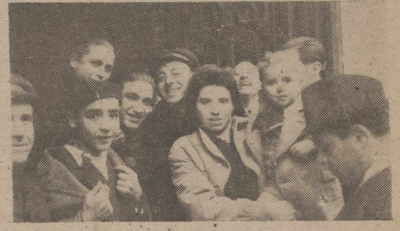
El personal de esta Compañía ha resultado agraciado con el premio de la Lotería. Sonrisas, abrazos, promesas, regalos, el «reportero» se ve materialmente estrojado entre la inusitada alegría de este personal modesto, agraciado con el mayor regalo de Pascua. ¡El «gordo» en nuestra Compañía!