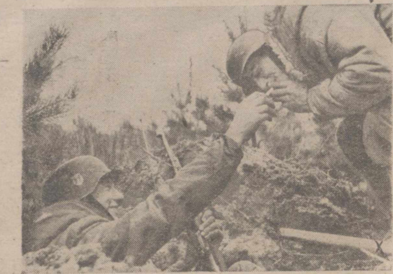
La pista está nuevamente en manos alemanas. Escondidos en hoyos profundos y bien protegidos con "anoraks" forrados de piel, contra la temperatura húmeda y fría, los granaderos del Reich aprovechan un descanso para liar un pitillo

Italia del Sur: Continúan los intensos combates defensivos al oeste de Venafro.