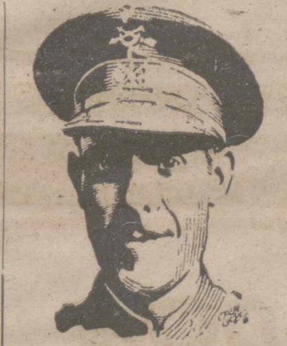
GENERAL ASENSIO, Ministro del Ejército

El secretario general del SEU, en nombre del Consejo, recoge las iniciativas expuestas en este informe y a continuación el camarada Cearle propone la creación de una comisión que se encargue de llevar a la práctica las conclusiones de este informe.