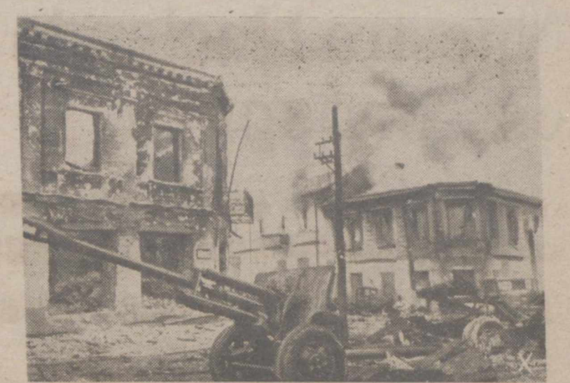
La batalla de Jitmir fue una de las más enconadas del pasado diciembre. Antes de la evacuación se combatió breves, pero duramente. La artillería bolchevique no pudo obstaculizar la acción de los carros alemanes