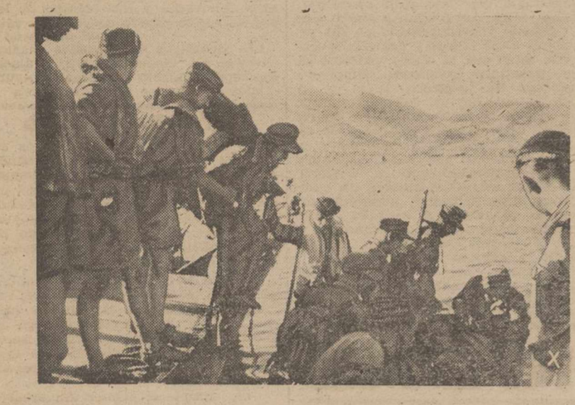
Soldados del Ejército alemán, llegan a reforzar la guarnición de la isla de Elba, con ocasión de su ocupación por las fuerzas del Reich

La ciudad aún está en poder de los alemanes