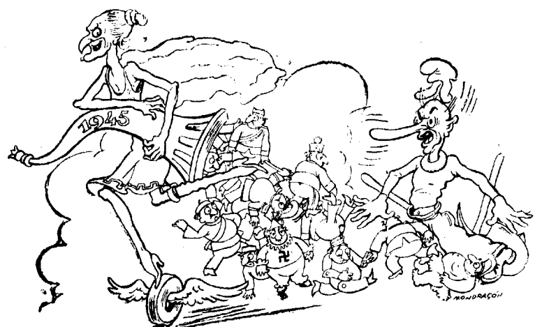
Dibuix de Mondrago

10a. — Reorganització de l'ensenyament i accés de les capacitats, sigui la que vulgui llur situació econòmica, a tots els graus de cultura.