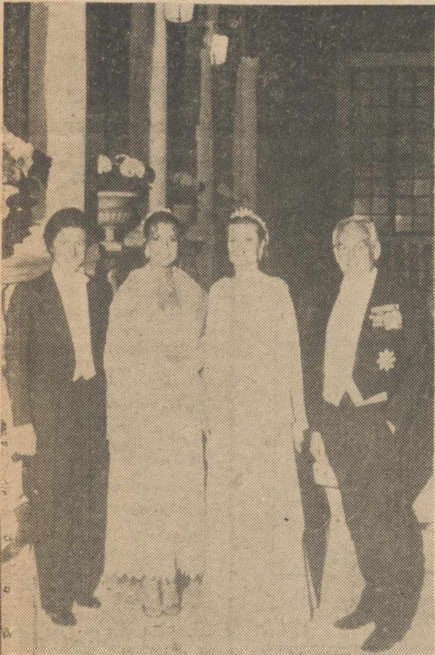
MONACO. — La princesa Carolina, con su prometido Philippe Junot, posando junto a sus padres la princesa Grace y el príncipe Reiniero de Mónaco, durante el baile que con motivo de la próxima boda de la princesa Carolina ha tenido lugar en el Palacio de Mónaco.

IMPORTANTE FABRICA DE LAMPARAS DECORATIVAS CLASICAS Y MODERNAS