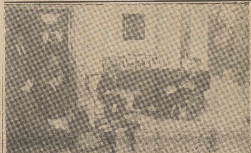
MADRID. — SS. MM. los Reyes Don Juan Carlos y Doña Sofía, han ofrecido en su residencia del Palacio de la Zarzuela un almuerzo al presidente electo de Colombia, doctor Julio César Turbay. Asistieron al mismo el presidente del Gobierno, don Adolfo Suárez y el ministro de Asuntos Exteriores, don Marcelino Oreja. —.

El Gobierno puede utilizar un Decreto-Ley o bien aplicar la vía de urgencia.