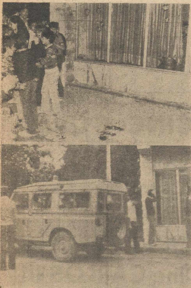
SAN SEBASTIAN. — Arriba, impactos de bala y manchas de sangre en el lugar en el que se produjo el atentado contra un automóvil de la Policía Armada en el barrio de Biderrieta, en el que ha muerto un sargento y tres números han resultado heridos. Abajo, el jeep en el lugar del atentado.