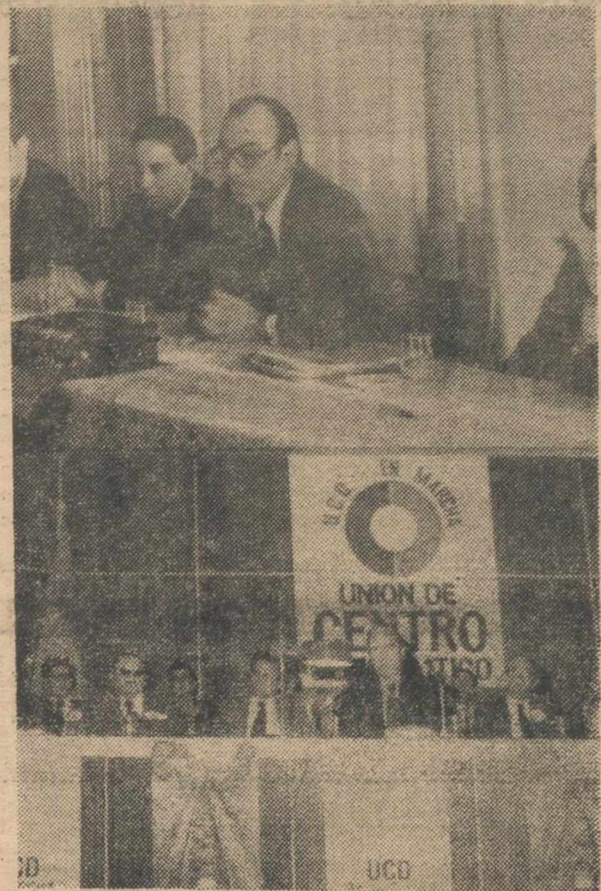
Arriba, el vicepresidente tercero del Gobierno, señor Abril Martorell, durante una rueda de Prensa, a su llegada a Valencia, para celebrar un mitin dentro de la campaña UCD en Marcha. Abajo, el ministro de Agricultura, señor Martínez Genique, durante el mitin celebrado en Burgos.

MADRID, 6 (Efe).—Ocho-cientos mil participantes, 253 provincias es el balance realizado por el Comité Ejecutor y 53 acios en 33 (Pasa a la ULTIMA)