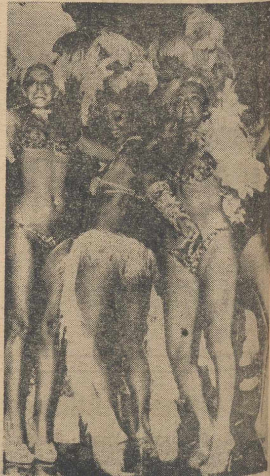
RIO DE JANEIRO.—Unas jóvenes bailando al ritmo de samba, durante el primer día del famoso Carnaval de Rio al que asisten miles de personas.

De cualquier forma, y según han informado las autoridades, hasta el momento, éste es uno de los carnavales más tranquilos de los últimos años. Señalaron también que los casos policiales registrados "son los normales en cualquier época del año".