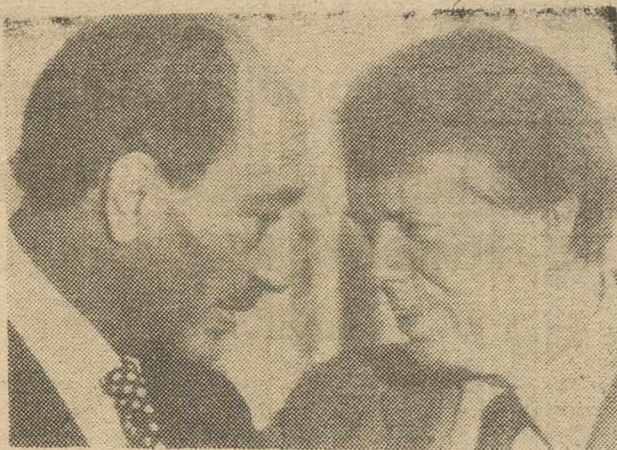
WASHINGTON. — El presidente egipcio, Anwar El Sadat, da la cara al presidente Carter, durante la ceremonia (en honor del primero), celebrada en la "Sala Este" de la Casa Blanca, el lunes. — (Telefoto EUROPA PRESS).

"Los palestinos, que dieron prueba de moderación y de un gran sentido de res-