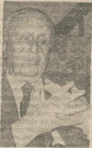
RAIMUNDO FERNANDEZ CUESTA Falange Española y de las JONS

"Mi voto, como ya saben, fue negativo, pero una vez producido el resultado y ya que ha sido positivo, debemos contribuir con nuestra actividad política a que el resultado del Referéndum sea lo más positivo para su convivencia y la vida política de todos los españoles".