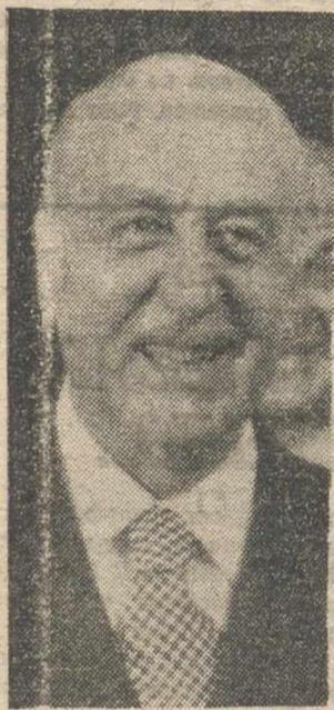
JOSE MARIA DE AREILZA. Partido Popular

"La votación masiva en favor de la Ley de Reforma Política es un voto de confianza al Gobierno, para que lleve a cabo la instalación definitiva de un sistema democrático en las Instituciones públicas de nuestro país".