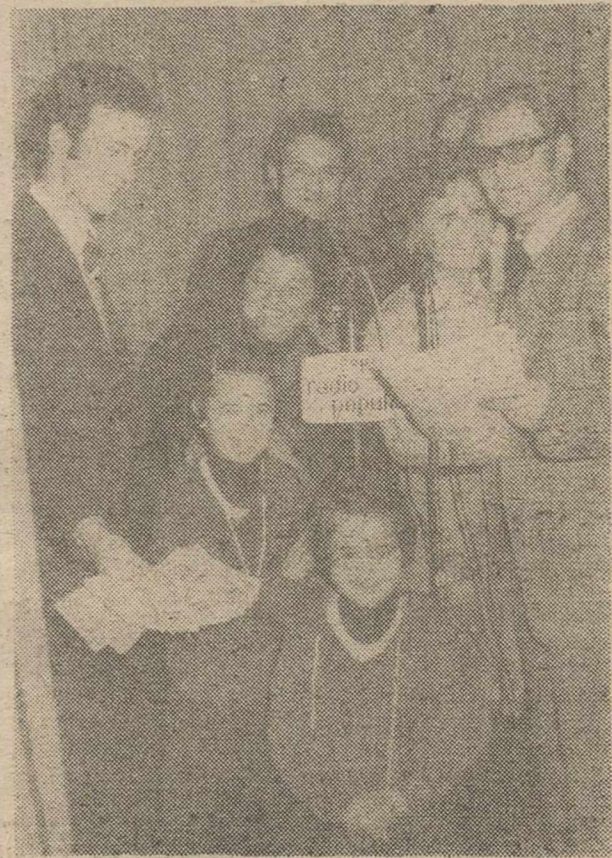
ra la próxima edición.