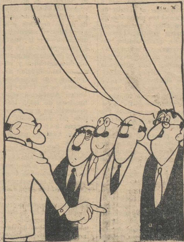
Al menos ya no se sabe si se trata de parados o de huelguistas...

no sólo la empresa pública, sino la propia Administración debería remodelar sus usos, porque tampoco son siempre correctos y, si no, que lo digan los profesores contratados de la Universidad.