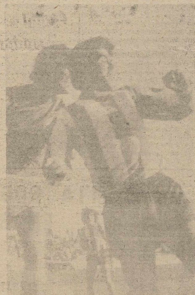
En el reportaje gráfico de J. MORENO, un sector del público, que asistió al encuentro Atlético Albacete-Hellín, y una jugada, en el centro del campo.

por la cual el árbitro conversó con ambos capitanes y a partir de entonces mejoró algo la cosa en lo que a jugar con nobleza y deportividad se refiere. En ese primer período el colegiado sacó dos tarjetas blancas, una de ellas al local Roldán, a los 16 minutos, y la otra al visitante Poyatos, a los 42 minutos. En cambio no hizo igual en otras jugadas de mayor motivo para el consabido "tarjeteo", como por ejemplo a Flores, si bien éste, ya en la segunda parte, vio igualmente la tarjetita lo