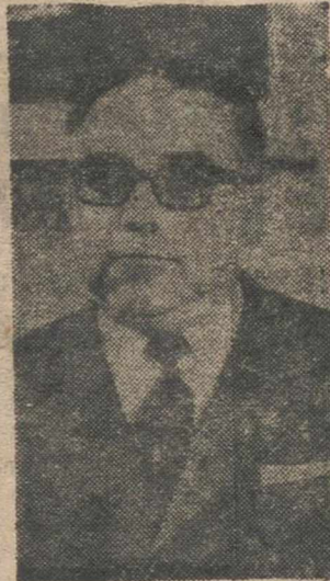
MADRID, 5.—El ministro secretario general