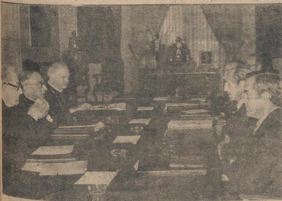
MADRID.—Un momento de la entrevista entre el secretario de Asuntos Públicos de la Iglesia, monseñor Casaroli y el ministro de Asuntos Exteriores, don Pedro Cortina Mauri, celebrada en el Ministerio de Asuntos Exteriores..

MADRID, 5.—A las diez y media de la mañana, monseñor Casaroli ha abandonado la sede de la Nunciatura Apostólica en Madrid, donde se hospedaba, y se ha dirigido al Ministerio español de Asun-