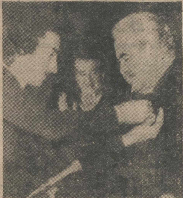
GIJÓN.—Don José Antonio Girón de Velasco recibe la Medalla de Oro del Sindicato de Actividades Diversas, en la clausura de las Jornadas Astur-Castellano-Leonesas de dicho Sindicato.—(Telefoto EUROPA PRESS).