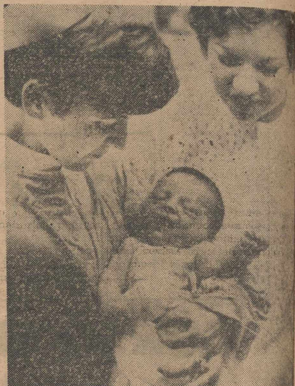
NUEVA ORLEANS.—El pequeño cuenta tan sólo 11 horas de vida cuando le fue implantado un marcapasos, los médicos aseguran que es la persona más joven a quien se le ha colocado el aparato en el mundo. Nació el niño con una lesión de bloqueo del corazón congénito. Se espera que dentro de diez días vuelva a casa.