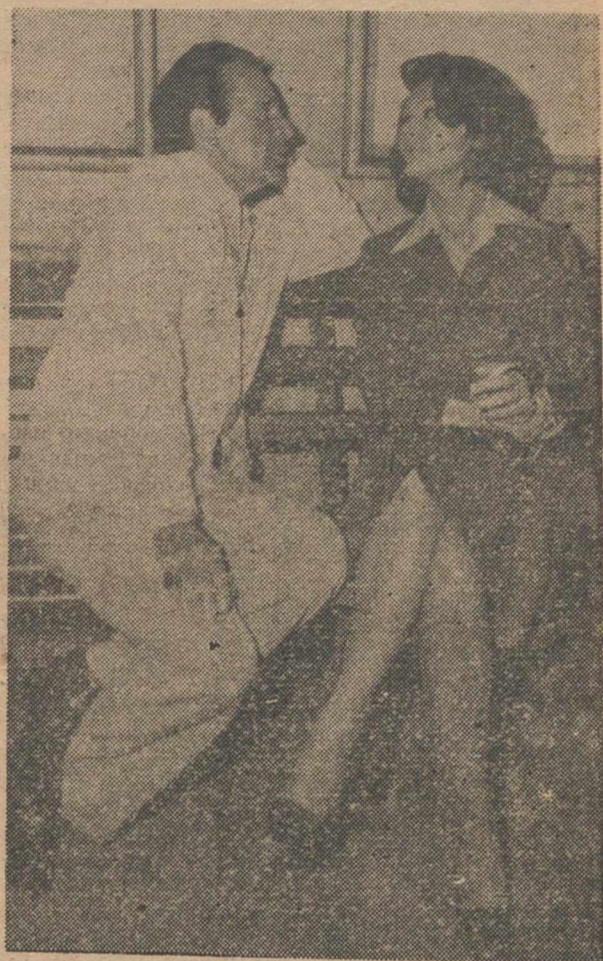
NEW FOREST (Hampshire, Inglaterra).—Los turistas que se encuentran en esta zona del Sur de Inglaterra se han acercado a este hermoso bosque para ver el rodaje de la nueva versión que sobre la comedia de Noel Coward, "Breve encuentro" están realizando Sofia Loren y Richard Burton.