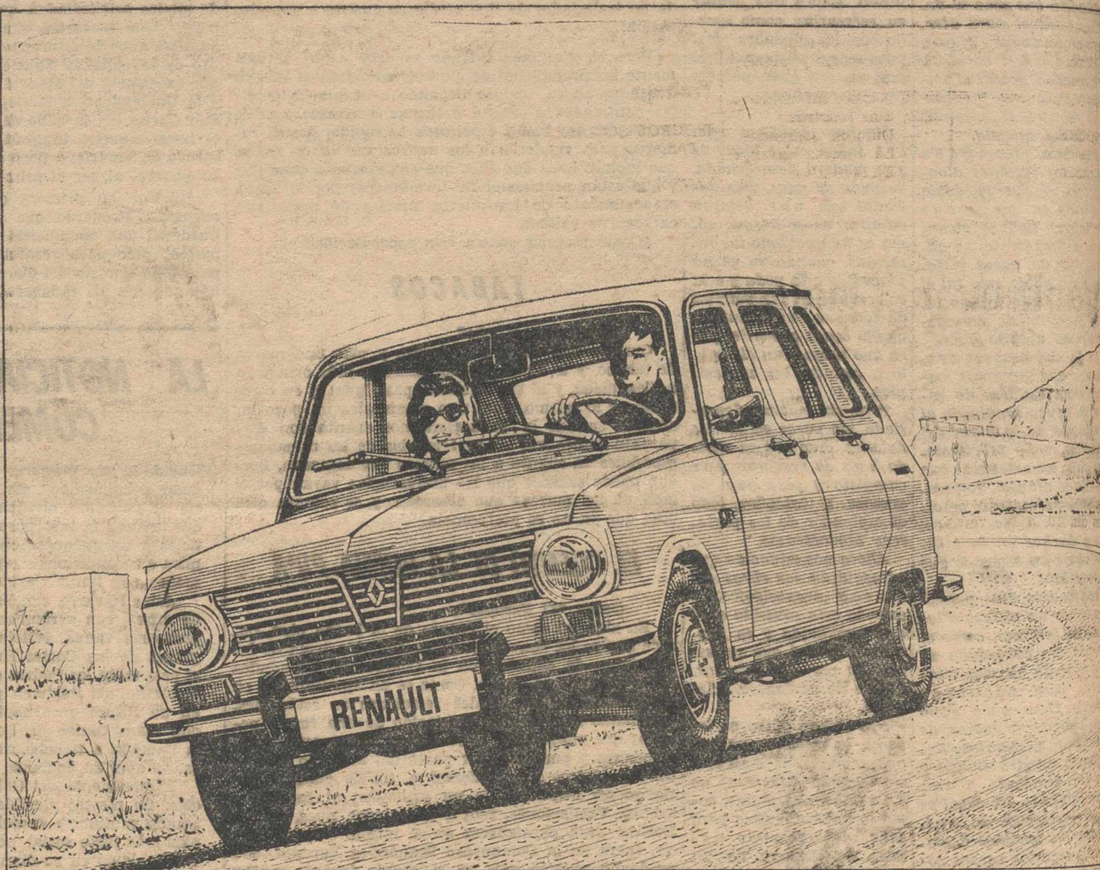
Un motor potente para su libertad de acción