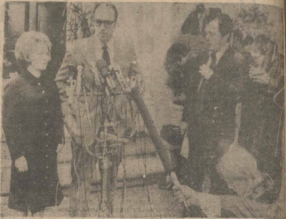
HILLSBOROUGH (California).—Con la angustia de una semana de espera en sus rostros, el magnate de la Prensa, Randolph A. Hearst y su esposa, hablan con los periodistas, acerca del secuestro de su hija, Patricia, de 19 años. Hearst dijo que si los terroristas del llamado Ejército de Liberación Symbionese, no son los autores del secuestro, como proclaman, la única posibilidad es que haya sido víctima de un loco criminal.