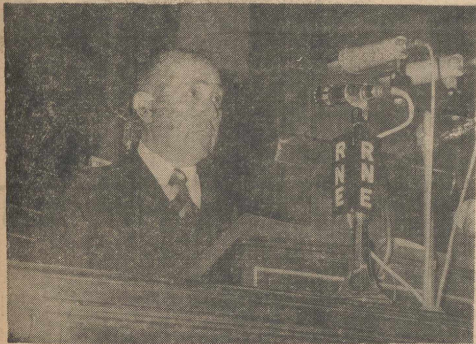
MADRID.—El presidente del Gobierno, don Carlos Arias Navarro, durante su importante discurso, en la sesión plenaria de las Cortes Españolas, primera de éstas que se celebran después del asesinato del anterior presidente, almirante don Luis Carrero Blanco.

Juventud, orden, apertura y participación, puntos programáticos del Gobierno