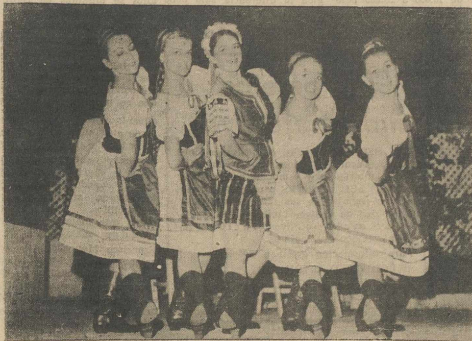
Las bellas chicas del Ballet Russe Pliaska

—Nada de eso. Primero, porque sabes que igual te están viendo seis o diez millones de espectadores, que de otra forma sería imposible. Porque puedes trabajar más concentrado, sin sentir las influencias de reacciones anormales de algún espectador de butaca o galería, que pueden romper, por una simple tos o un aplauso a destiempo, una situación trascendental en la obra y en el actor, con relación al personaje. Decididamente, el calor del público no es conveniente. Lo fundamental, lo vital, es sentir respeto al público y darle, en lo interpretativo, todo lo que uno lleva dentro. Lo del contacto directo, estimo que es secundario.