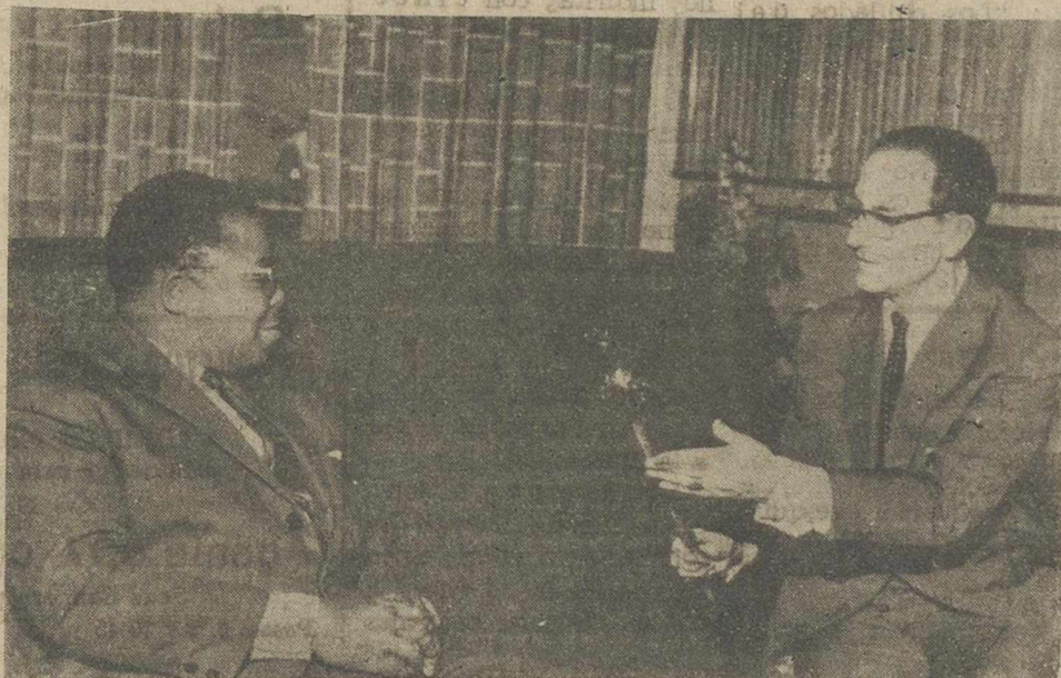
En la foto, el presidente de la República del Congo, Joseph Kasabvu, recibe del ministro de Comercio español, señor Ullastres, una espada toledana, reproducción de la de San Fernando, durante su reciente estancia en la capital del Congo. (FOTO FIEL).