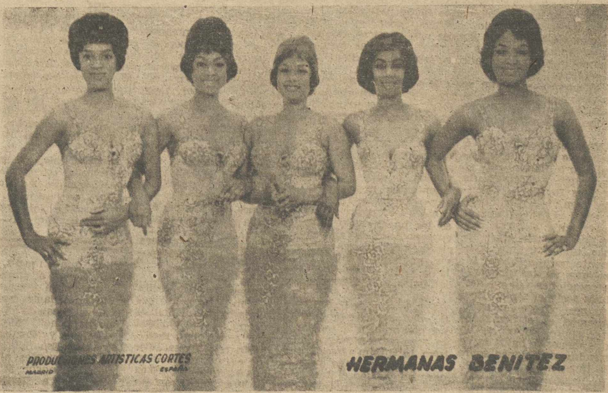
PRODUCCIONES ARTISTICAS CORTES