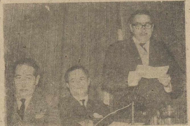
Intervención del jefe de la Hermandad de Labradores y Ganaderos de Bienservida, durante el acto de clausura del Consejo Económico-Sindical, celebrado el sábado en Alcaraz.