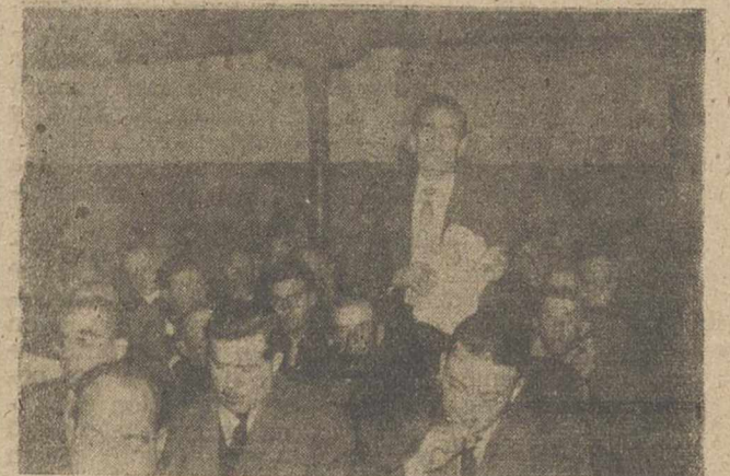
Durante las sesiones de trabajo del Consejo Comarcal de Alcaraz fueron muy frecuentes las intervenciones de consejeros, como este que recoge la fotografía y que demostraron el gran interés que sus deliberaciones han despertado.