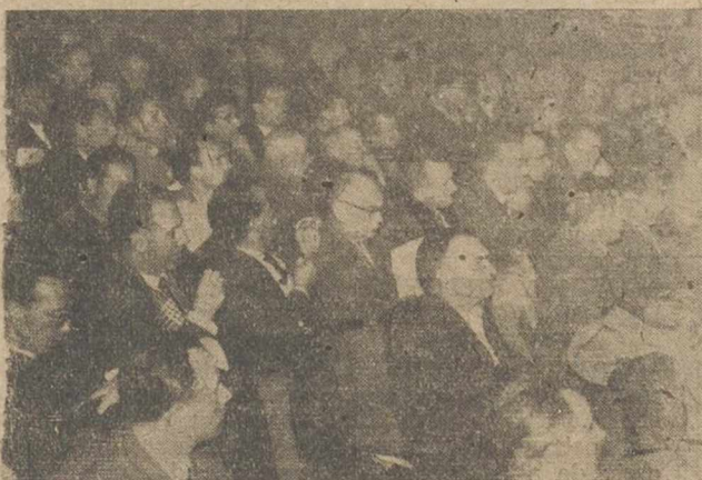
Como en Casas Ibáñez, en Alcaraz, los consejeros y un numeroso público llenaron el teatro, durante la sesión de Clausura del Consejo Económico Sindical, cuyas deliberaciones se siguen con extraordinario interés en toda la provincia.

Los pueblos de la Sierra de Alcaraz, piden sabiendo lo que piden, y Albacete, la capital de la provincia, sus autoridades y sus técnicos, sus funcionarios del Estado, estudian con cariño estas peticiones, como las de las zonas de Levante, la Mancha y Sudeste, en pro de una provincia mejor y de un mayor bienestar para todos los albacetenses. ¡Saludemos a estos albacetenses de la Sierra de Alcaraz, ya en los umbrales de la iniciación de las reuniones de los albacetenses de la Zona de la Mancha, que en Villarrobledo van a laborar también por la grandeza de España.