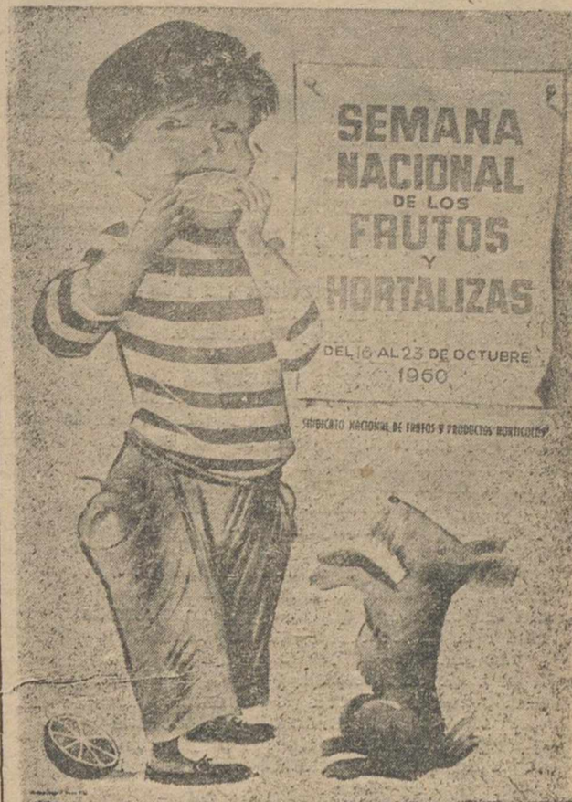
Cartel anunciador de la "Semana Nacional de Frutos y Hortalizas", que en estos días se está celebrando con extraordinario éxito y brillantez.