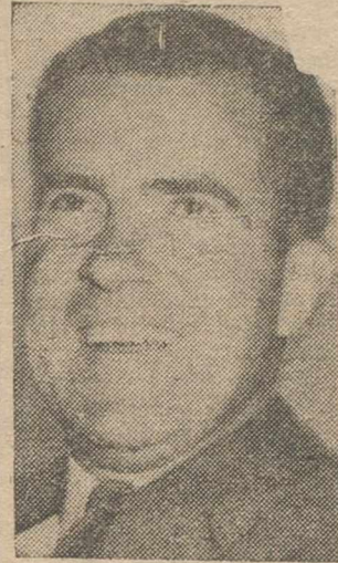
CHICAGO, 2.—El vicepresidente de los Estados Unidos, Richard Nixon, ha

manifestado que había conseguido realizar "algunos progresos" en su campaña para que se adopte el punto de los derechos civiles en el programa del partido republicano.