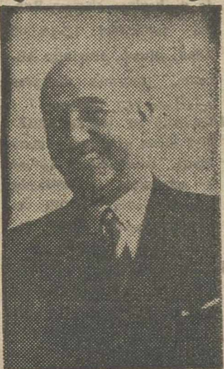
la política soviética en sus relaciones con el mundo libre.

—Cuanto más unido se muestre el Occidente, más razonable se ha de presentar