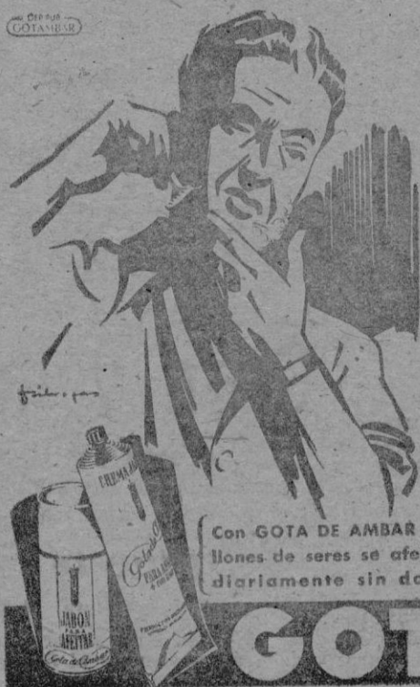
Con GOTA DE AMBAR millones de seres se afeitan diariamente sin dolor