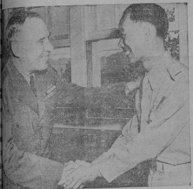
Captán de Corbeta Corydon M. Wassell estrecha la mano a un primer teniente de la Aviación China

Buenos Aires. — La Institución Cultural Española ha concedido a Benavente la Medalla de Oro anual al americanista español que más haya beneficiado las relaciones hispanoamericanas.