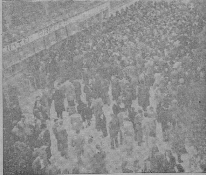
Las copas donadas por nuestras autoridades. — Una vista del público durante un intermedio