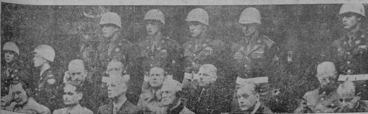
De izquierda a derecha, los acusados: Goering, Hess, Von Ribbentrop, Keitel, Rosenberg, Frank. Sentados detrás Doenitz, Raeder, Von Schirach, Sauckel y Jodl