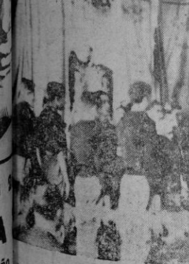
Se imponen las medallas a la Vieja Guardia, en la Lonja

Después de la misa el celebrante entonó un Responso en sufragio de las almas de los que dieron su vida por la Patria durante la Cruzada.