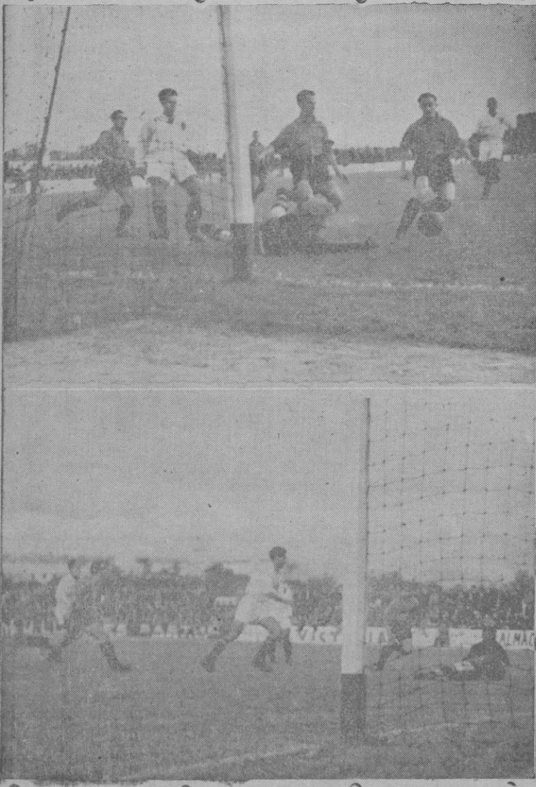
Dos momentos de peligro, ante la meta del Ceuta, que no M.C.DJ.2022 fueron aprovechados por la delantera local

Enfermedades Tratamiento med trax, Sífilis y SEBASTIA Consulta de 10 a San Miguel,