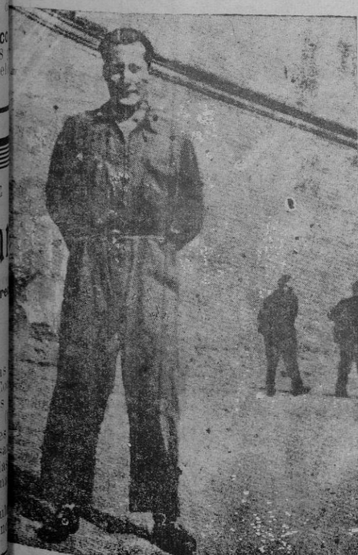
Antonio Primo de Rivera en la Cárcel Modelo

en la madrugada de nueve años, caía José Antonio Primo de Rivera, en los campos de Africa, el 18 de julio de 1936. El Movimiento interpretó y tradujo, desde el primer momento, y lo ha hecho realidad cada día más incommovible, el manifiesto arrebatado del pueblo español para acabar con las guerras civiles, instaurando en las alturas de la Nación los principios permanentes e inmutables de la mejor tradición española, entroncados con las medidas encaminadas a hacer sentir a todos los españoles el orgullo y la satisfacción de serlo. La sofisticación que las ideologías importadas hicieron de la recia personalidad española motivó las guerras civiles de la pasada centuria, promovidas por la resistencia del auténtico espíritu español a ser desplazado y barrido de España. Pero el Movimiento empezado en 1936 no sólo representó el anhelo de acabar con las discordias intestinas, sino también el afán de liquidar definitivamente el proceso histórico de la disolución de España, iniciado hace más de un siglo y acelerado, con peligro de la propia Patria, por la actuación del Frente Popular en el poder. José Antonio tuvo el acierto de intuir esta línea ideológica y de votar a ella su propia vida, en el momento de perderla, por los ideales que sembrara y que han fructificado magníficamente en los años transcurridos desde aquel día otoñal de 1936.