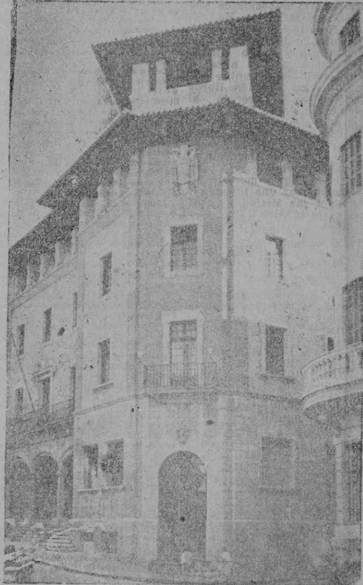
Fachada del nuevo Palacio de Comunicaciones

Cuando estas líneas lleguen al lector, se encontrará ya en Mallorca el Excmo. Sr. Ministro de la Gobernación, don