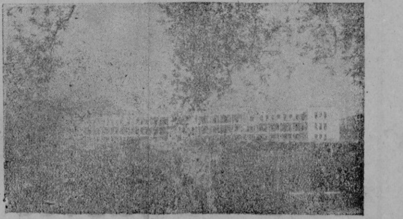
Fachada frontal del Sanatorio antituberculoso «Caubet»