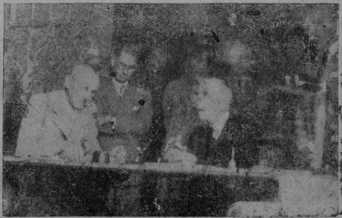
La firma de la escritura de cesión de un solar a la Asociación de la Prensa, en el despacho de la Alcaldía.

Trabajo. — Resolución relativa al plus de cargas familiares en la reglamentación del trabajo en la Banca privada.