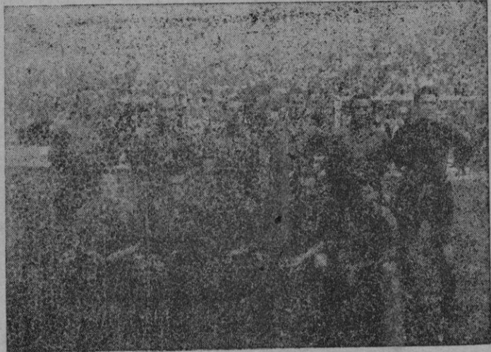
El once del Mallorca que en el partido inaugural de Es Fortí, venció merecidamente por 3 a 0 al Xerez

Tras el tercer gol, los jugadores locales acoptaron por reforzar la defensa de su mar-