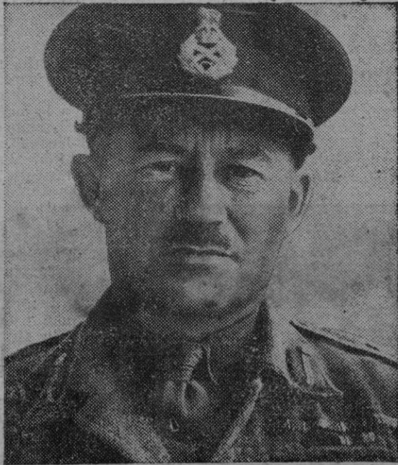
El Mayor General Bocher, Jefe de la 40 División india que opera en el frente birmano.

Pedirá el reconocimiento de la independencia, retirada de las tropas inglesas, una revisión de los tratados existentes entre Gran Bretaña y Egipto, en vista de los servicios prestados por este país a la causa de los aliados.