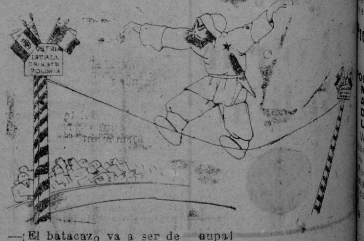
— El batacazo va a ser de aupal