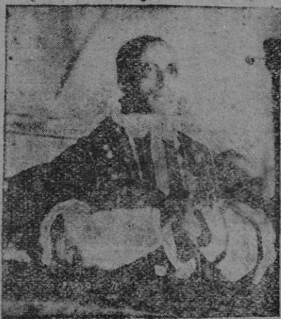
Ayer celebró su fiesta onomástica S. S. el Papa Pío XII.

menos en un sector, este mundo está devastado por la guerra. Ahora reina la paz, que solo podrá ser consolidada mediante constantes cuidados. Esta paz impone delicadas tareas a la Iglesia, tanto al Pastor como a su rebaño: todos tienen que cumplirlas, cada uno en su oficio y su puesto. Por lo que a Nos y a nuestra misión apostólica afecta, sabemos que podemos contar con vuestra cooperación, con vuestras oraciones y con vuestra devoción inalterable.