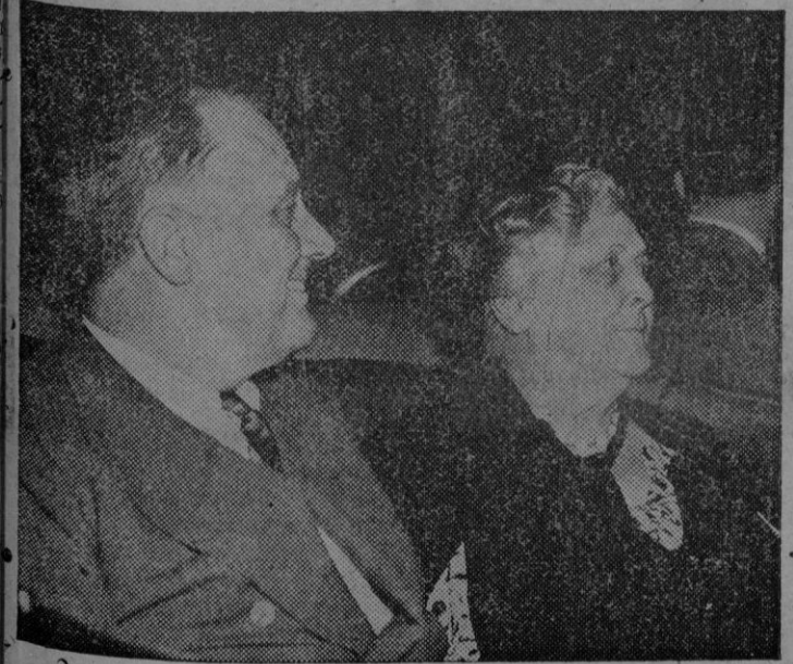
Recuerdos de la vida del Presidente Roosevelt.—El Presidente Roosevelt, con su madre, fallecida también, Sara Delano Roosevelt, en su finca de Hyde Park, en el Estado de Nueva York

TRUMAN A LA CASA BLANCA Washington.— El Presidente Truman y su familia se instalaron dentro de breves días en la Casa Blanca en la presidencia especial que el gobierno de los Estados Unidos ha destinado a sus invitados oficiales, donde también permanecerá la familia de Roosevelt hasta tanto se efectúe su traslado desde la Casa Blanca a su residencia particular de Hyde Park.