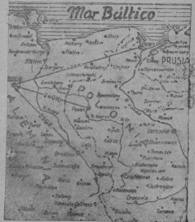
Mapa del teatro de la guerra del Este, con el río Oder, donde se desarrollan las grandes batallas originadas por la ofensiva soviética.