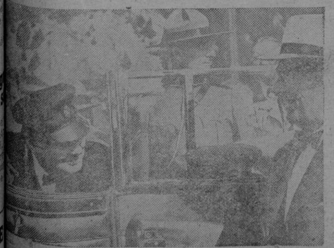
Una de sus más recientes fotografías, al saludar en Quebec a Roosevelt