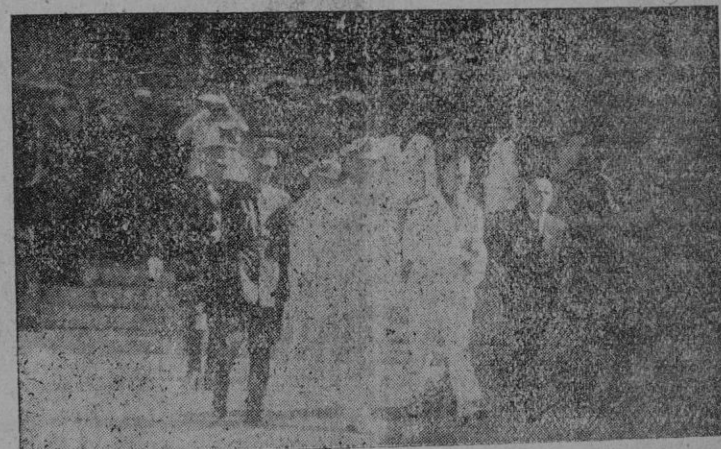
Las primeras Autoridades saliendo de la Basílica de San Francisco, en la mañana de ayer

En los lugares preferentes de la parte del Evangelio tomaron asiento: el Excmo. Sr. Almirante Jefe de la Base Naval y Jefe accidental de las fuerzas de Tierra, Mar y Aire, don Ma-