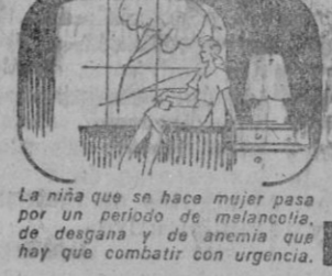
La niña que se hace mujer pasa por un período de melancolía, de desgana y de anemia que hay que combatir con urgencia.