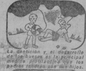
La debilidad y el desarrollo de los huesos es la principal medida profiláctica que los padres tendrán que seguir.