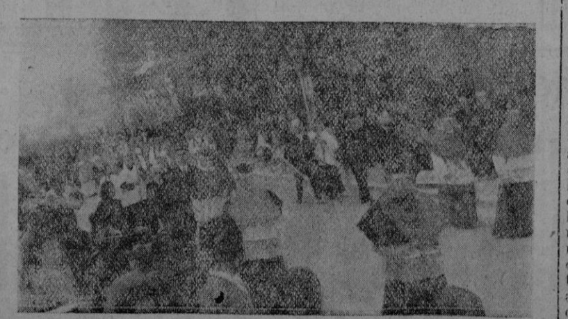
El paso de la imagen de la Sangre, por las calles de Palma, a la que acompañaba ingente multitud de fieles

Durante los días en que la imagen del Cristo de la Sangre permanezca en la Catedral, en la iglesia de la Anunciación (Hospital) se custodiara la venerada reliquia del trozo de la (Pasa a la 3.ª)