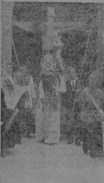
La imagen de la Preciosa Sangre, al ser sacada de la Iglesia del Hospital

El traslado de la imagen del Cristo de la Sangre a la Catedral, constituyó una imponente manifestación de fé religiosa