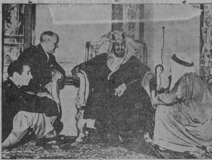
El Rey Ibn Saud, de la Arabia Saudita, conferencia con los miembros de una misión militar norteamericana en su palacio de Jidda

En estos momentos el Vesubio parece tranquilo y el vecindario regresó a sus hogares.